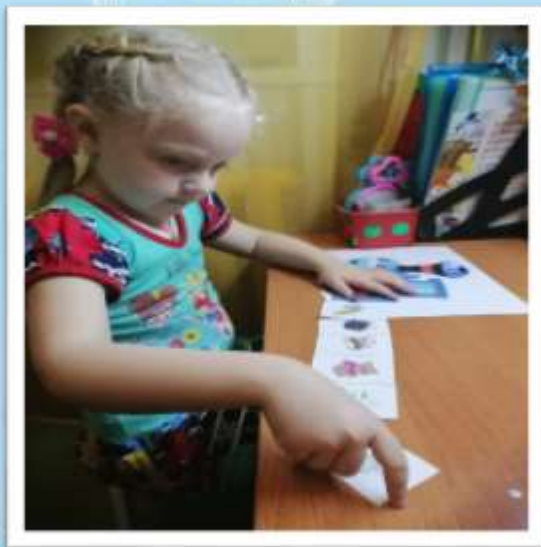
Игра «Логический поезд»