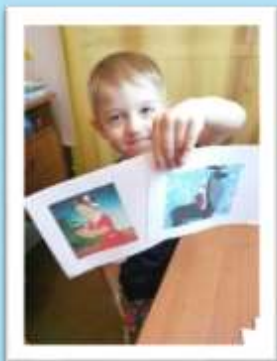
Игра «Герои сказок»