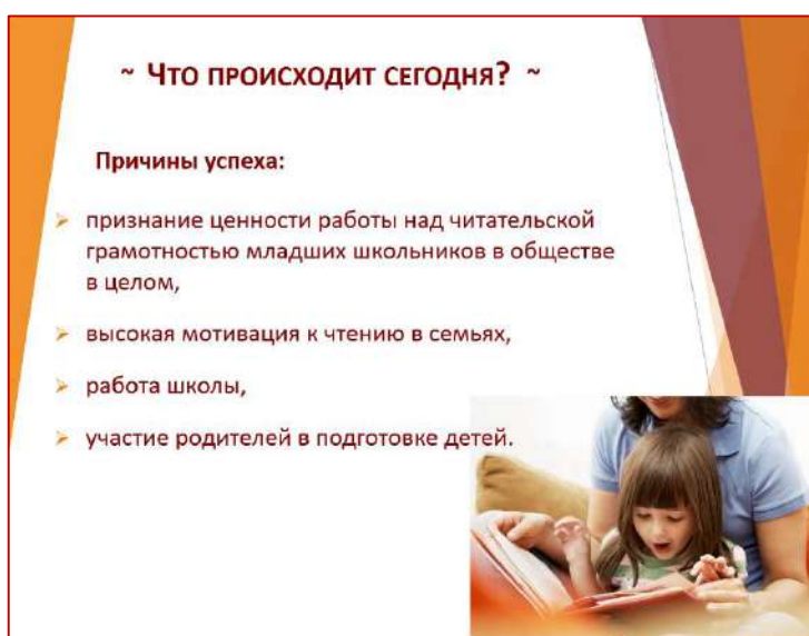
Слайд № 7