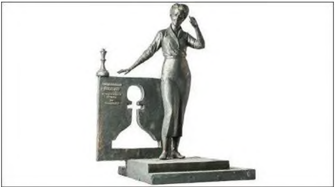
10. Мемориальная доска, посвященная великой шахматистке, на здании школы.