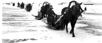
Порожний обоз направляется за продуктами для блокадного Ленинграда по льду Ладожского озера. 04.12.1943 г.

Блокада Ленинграда — одна из самых страшных и трагических страниц в истории Великой Отечественной войны. Ужасное испытание для жителей города на Неве длилось почти 900 дней (с 8 сентября 1941 г. по 27 января 1944 г.). Ленинград находился в окружении фашистских захватчиков и у жителей не было никакой возможности вырваться из этого ада. Из двух с половиной миллионов жителей, проживающих в северной столице до начала войны, за время блокады от голода, бомбежек и артобстрелов умерли, по разным данным, от 641 тыс. до 1 млн ленинградцев. Несмотря на голод, сильные морозы, отсутствие отопления и электричества, ленинградцы мужественно выстояли и не отдали врагу родной город.