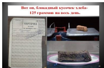
Карточка в блокад- ном Ленинграде — главный документ, который давал право купить продукты по государственным ценам.

Ленинград (ныне - Санкт-Петербург) - единственный в мировой истории город с многомиллионным населением, который смог выдержать почти 900-дневное окружение.