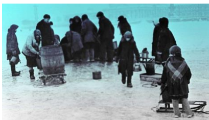
Жители блокадного Ленинграда берут воду из проруби на Неве

Надо знать, какой бывает война, чтобы знать какое это благо - мир... А.Адамович