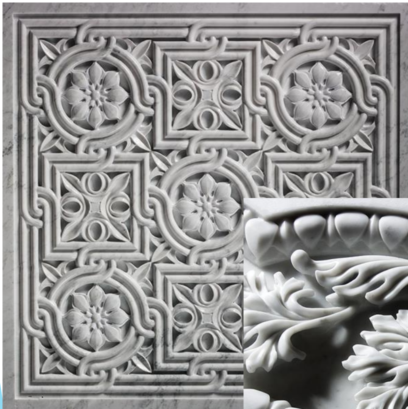
Резьба по мрамору