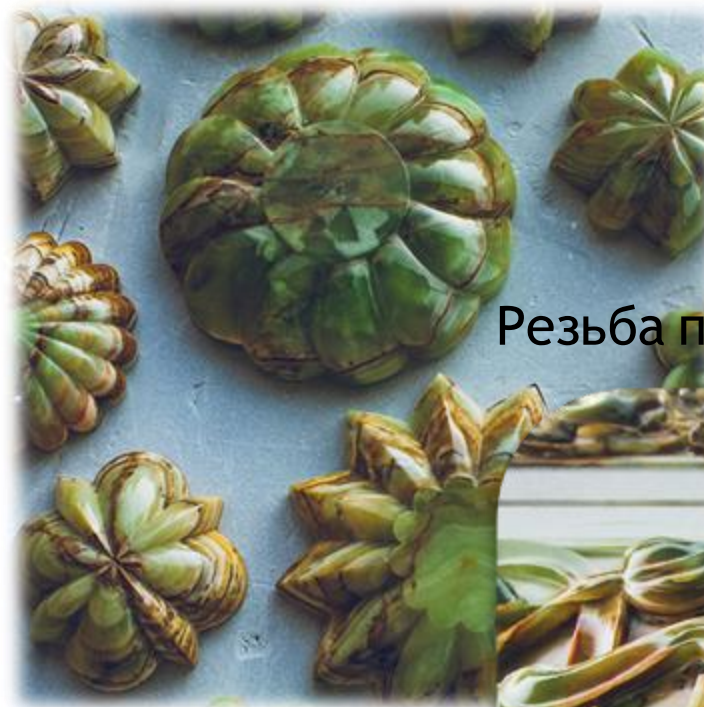
Резьба по зеленому ониксу