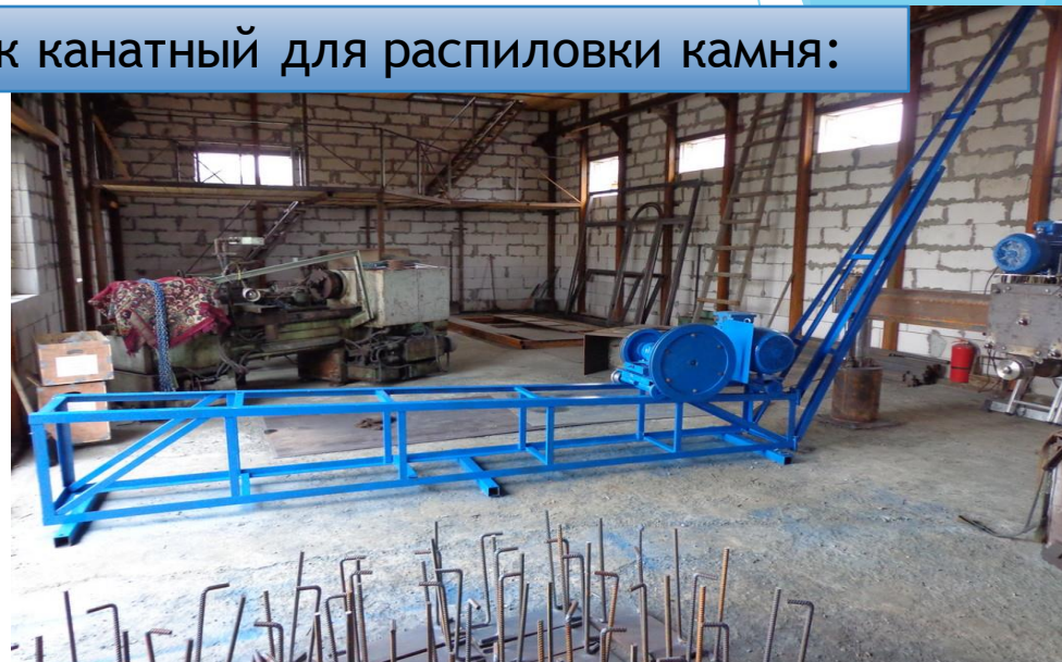
Станок канатный для распиловки камня: