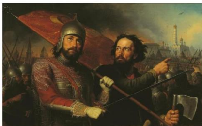
Скотти. Минин и Пожарский. 1850 г.

По всему Московскому государству рассылались из Нижнего призывные грамоты. Изнуренная и поруганная земля собирала на борьбу последние силы. Получив благословение патриарха Гермогена, нижегородцы возглавили эту борьбу. И в самых дальних уголках Российского государства стал разноситься пламенный призыв нижегородцев: «Купно за едино!» («Вместе за одно!»).