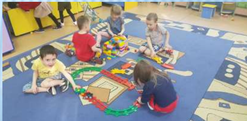
... и строители!