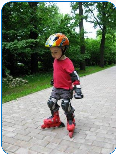
Катать на роликах