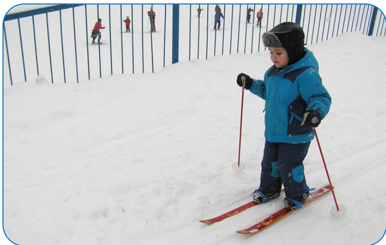
Кататься на лыжах