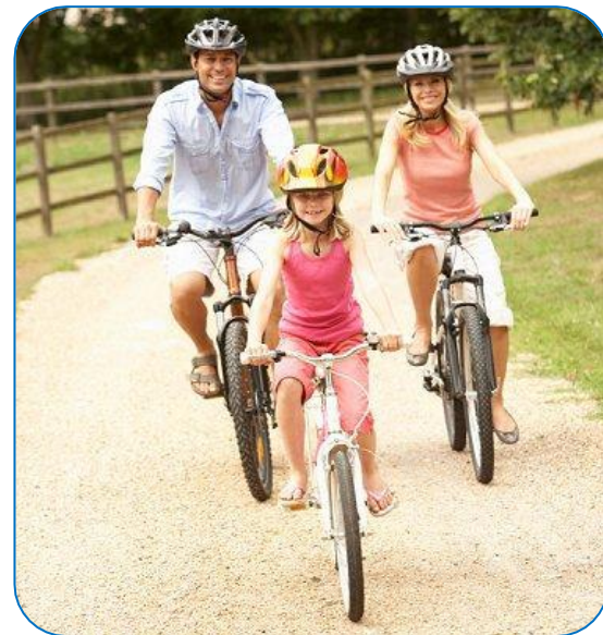
Кататься на велосипеде