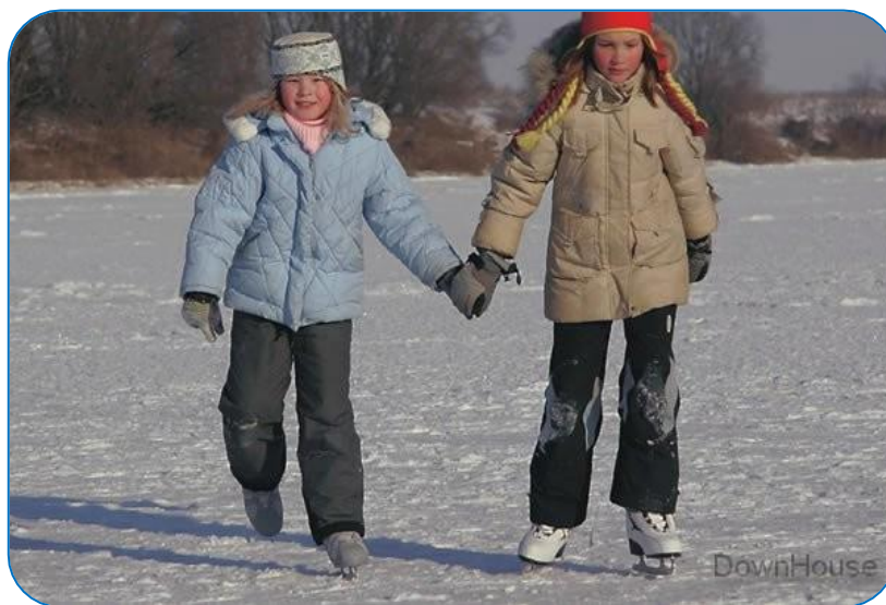
Кататься на коньках