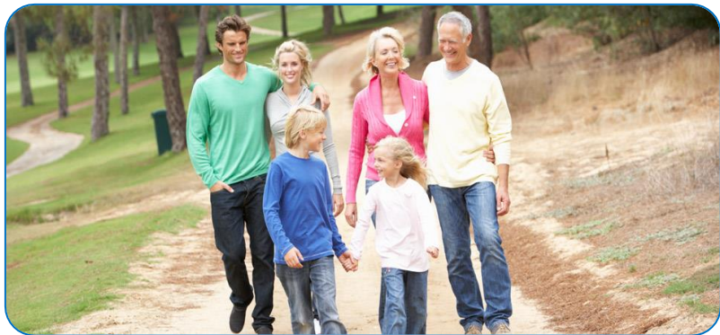
Больше гулять на свежем воздухе

С ними будем мы дружить, Чтоб здоровыми нам быть.