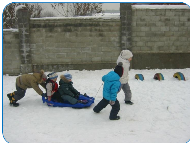
Кататься на санках