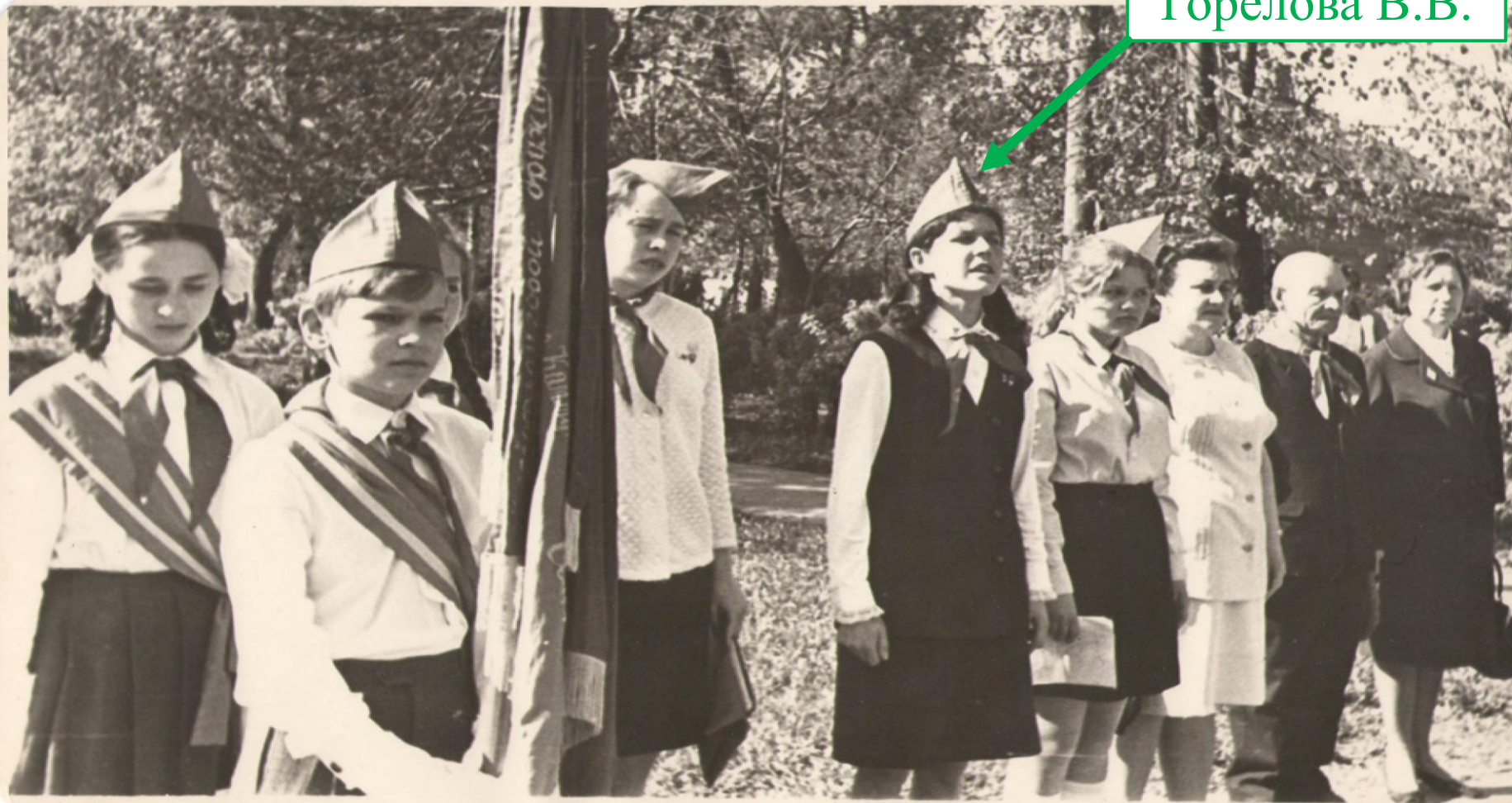
Юбилейный приём в пионеры 1972 г.