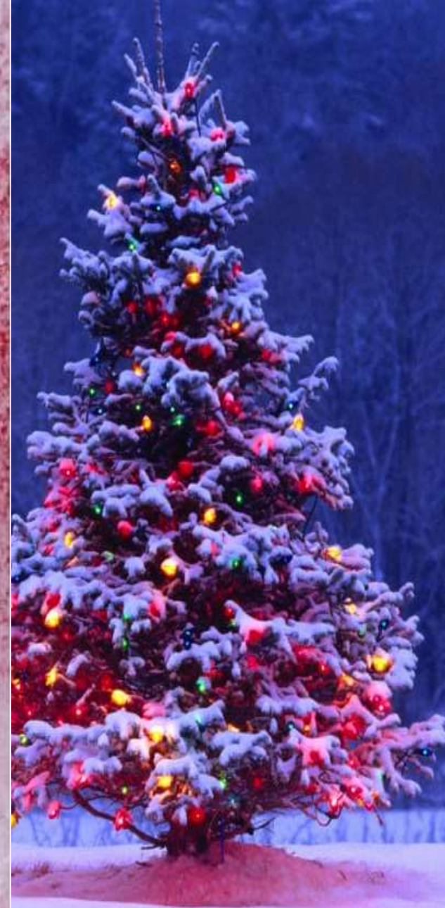
Prosit Neujahr (Прозит Нойяр)