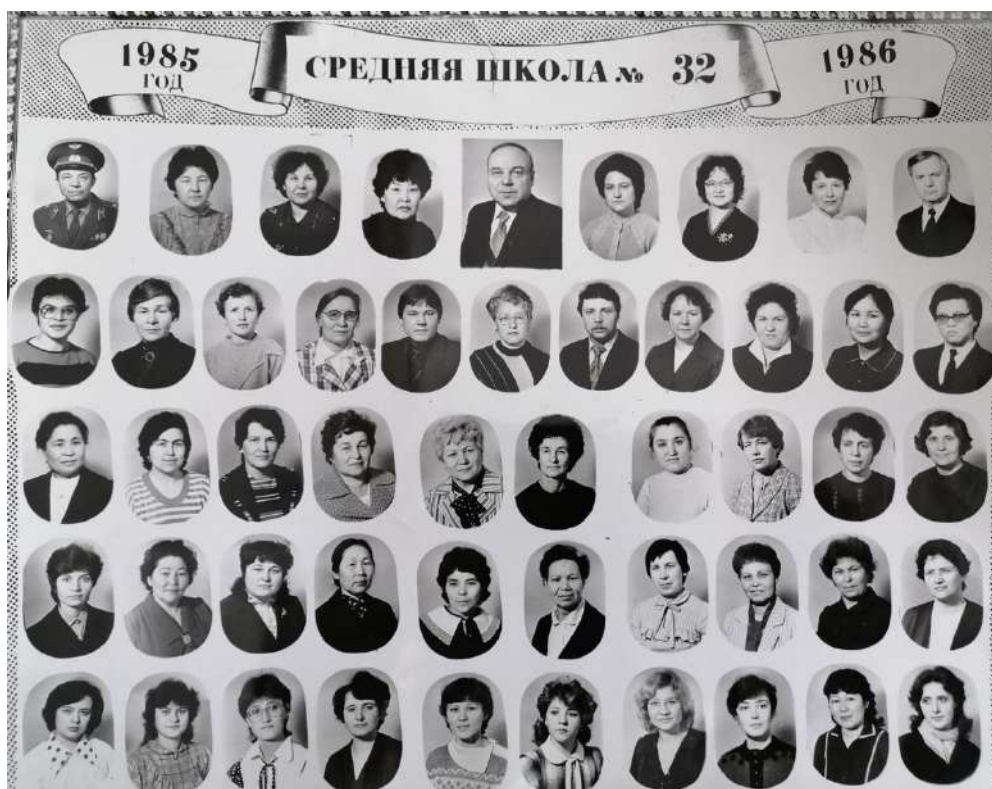
Педагогический коллектив 32 школы