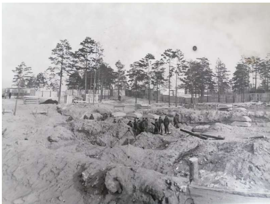
Начало строительства 32 школы