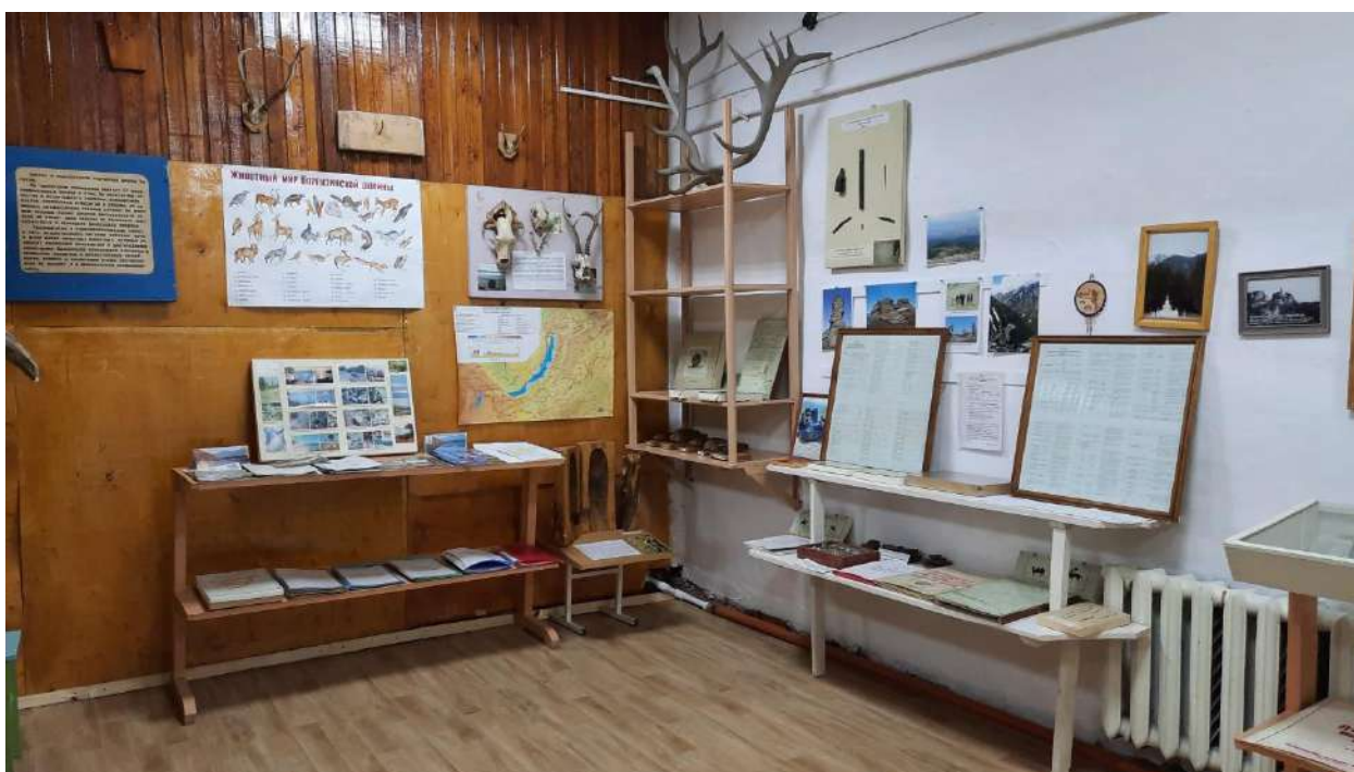
Отдел культуры и этноса