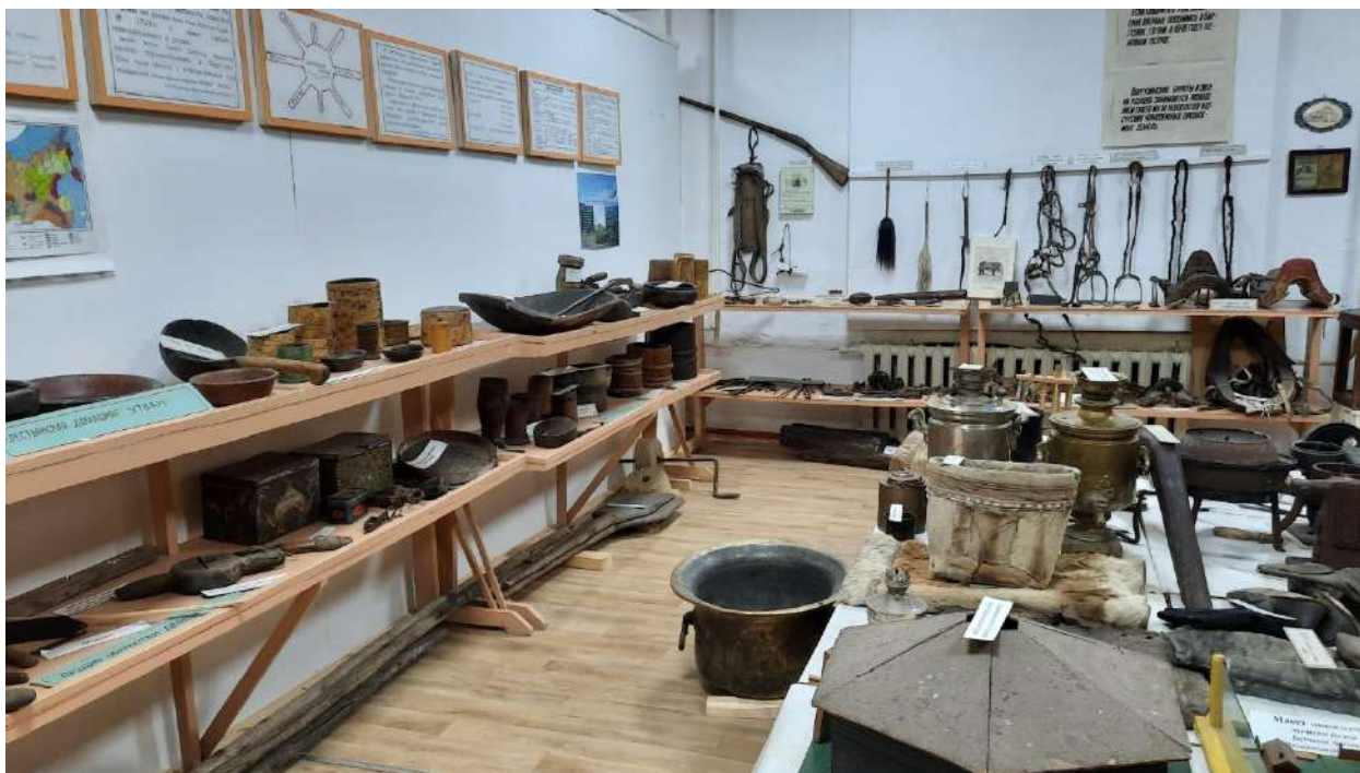
Отдел культуры и этноса