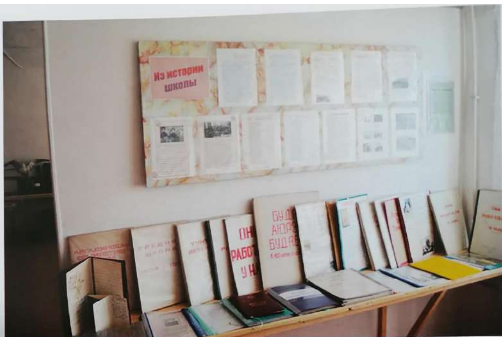
Отдел истории школы