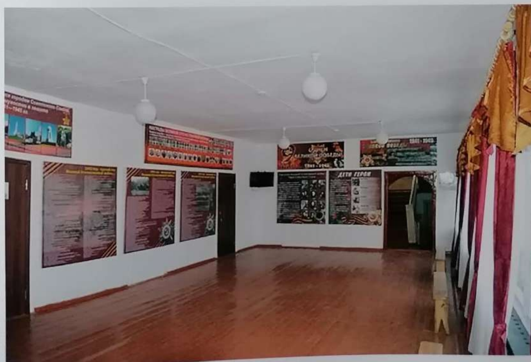
Зал Боевой Славы