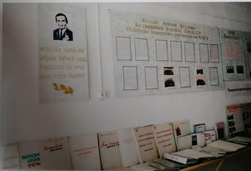
Отдел истории школы