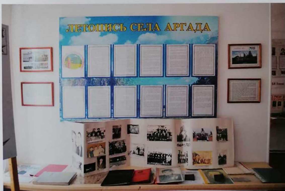
Отдел истории села