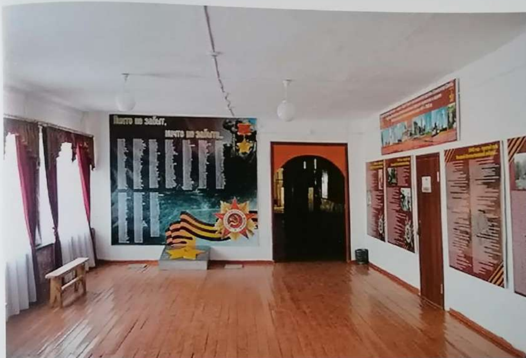
Зал Боевой Славы