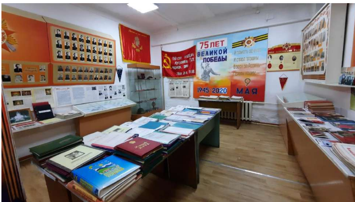
Зал боевой и воинской славы.