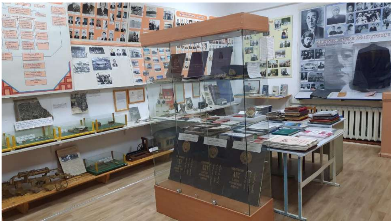
Отдел истории колхоза