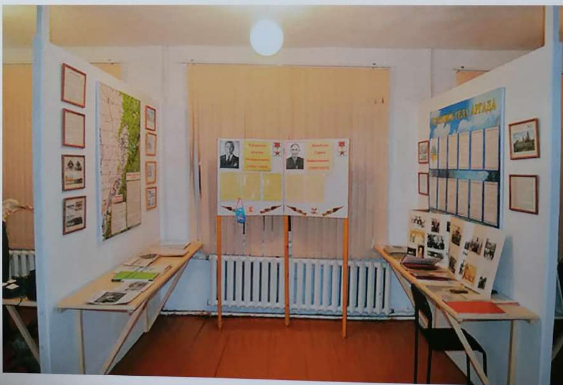
Отдел истории села