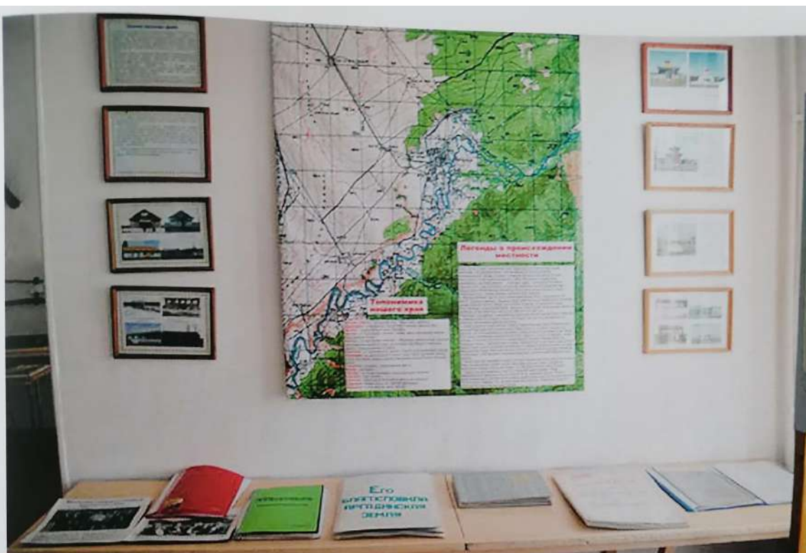
Отдел истории села