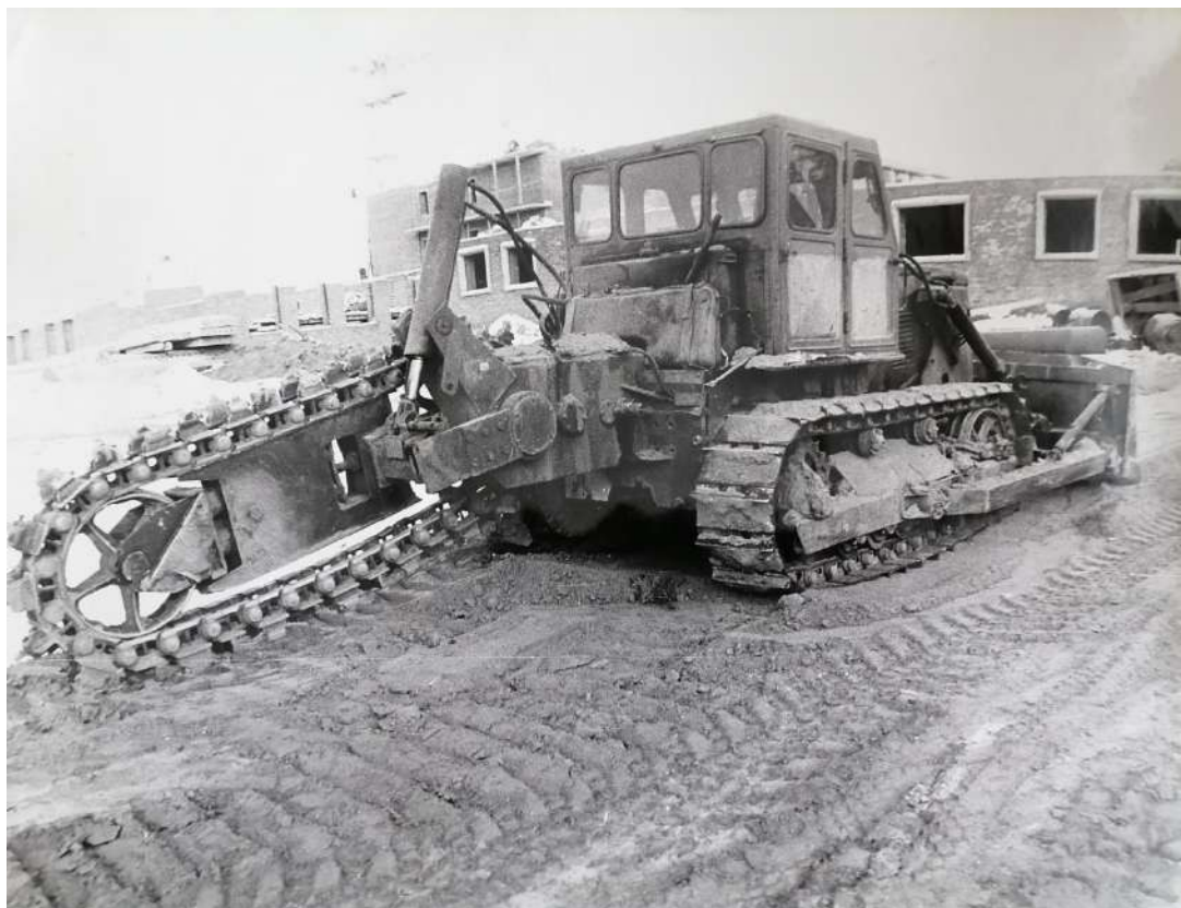
Начало строительства 32 школы