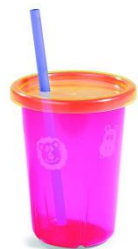
шторм в стакане

Предложите ребенку подуть на отцветший одуванчик (следите за правильностью выдоха).