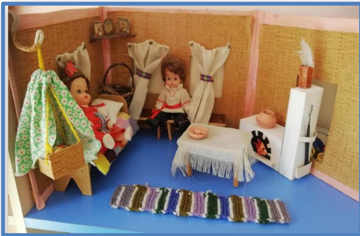
Мини-Музей русская изба