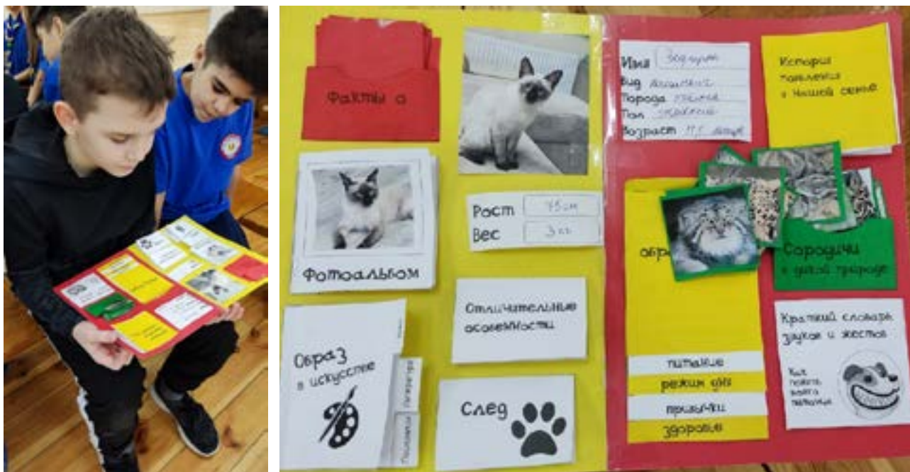
Готовый лэп-бук. На фото - учащиеся 4 класса

Полезные: уютно устраивается спать на коленках и мурлычит, от этого хозяину очень приятно. Кроме этого в работе нужно отразить такие данные: что нужно для того, чтобы зверь оставался здоровым (гулять, принимать витамины, вовремя делать прививки, стричь когти, поставить колесо для бега и т.п.), сделать отпечаток лапы и померять его линейкой, записать 9 фактов, историю появления в семье, краткий словарь жестов и звуков, исследовать диких сородичей.