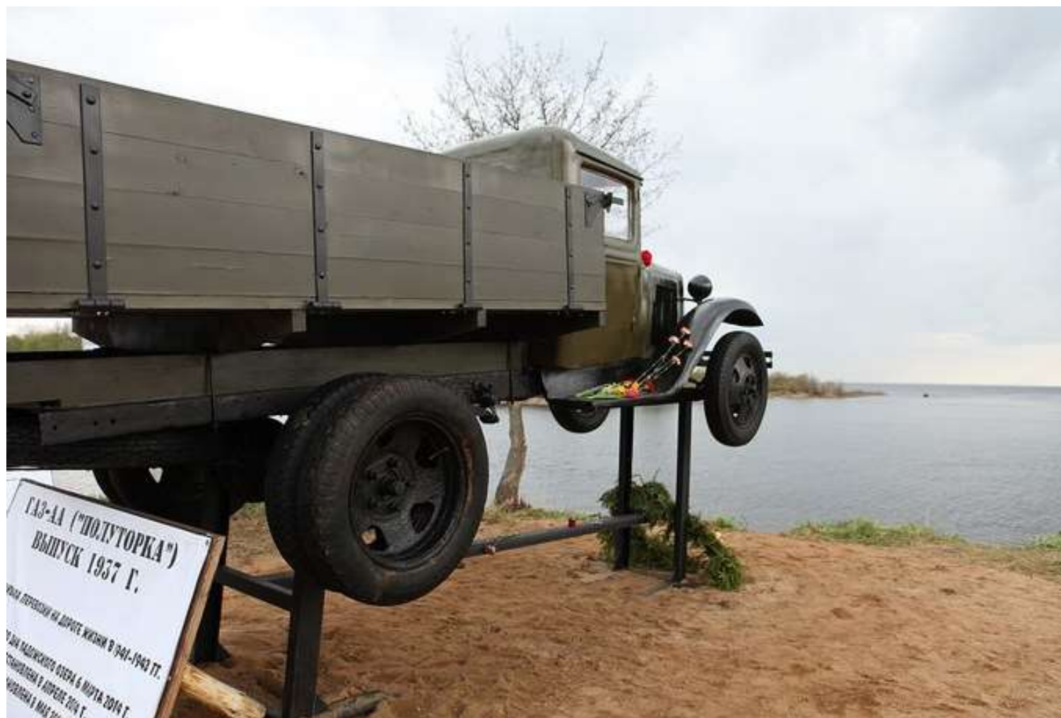
Копия «Полторки» на берегу Ладожского озера