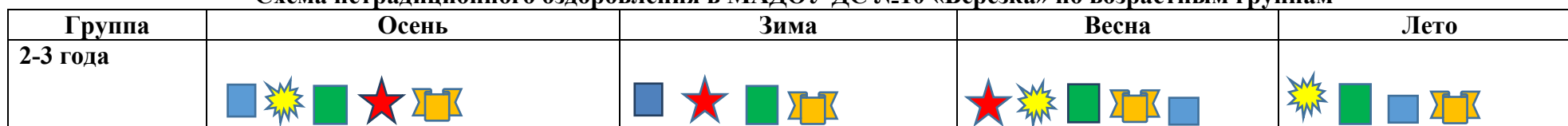
Схема нетрадиционного оздоровления в МАДОУ ДС №10 «Березка» по возрастным группам