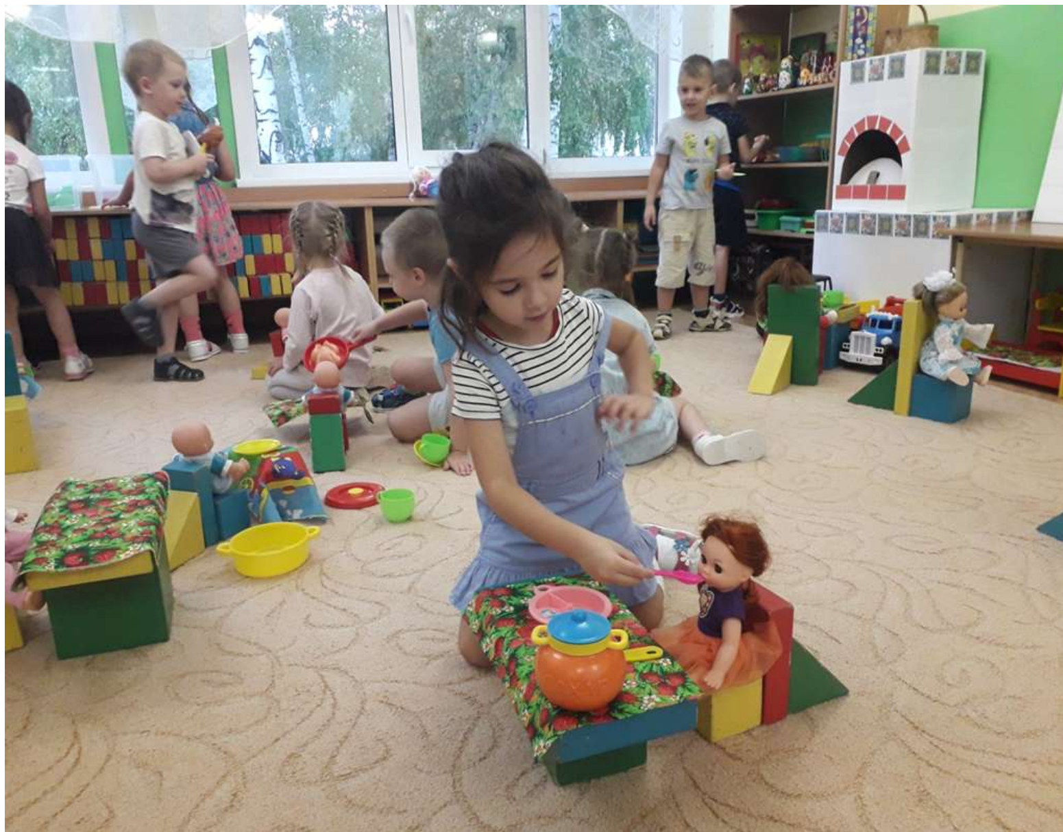
Сюжетно-ролевая игра «Дочки-матери»