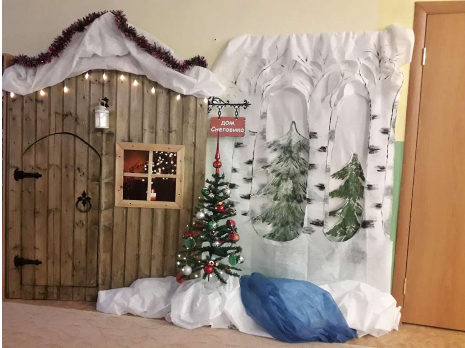
Оформление тематического новогоднего уголка в группе «Новогодняя сказка у домика Снеговика»