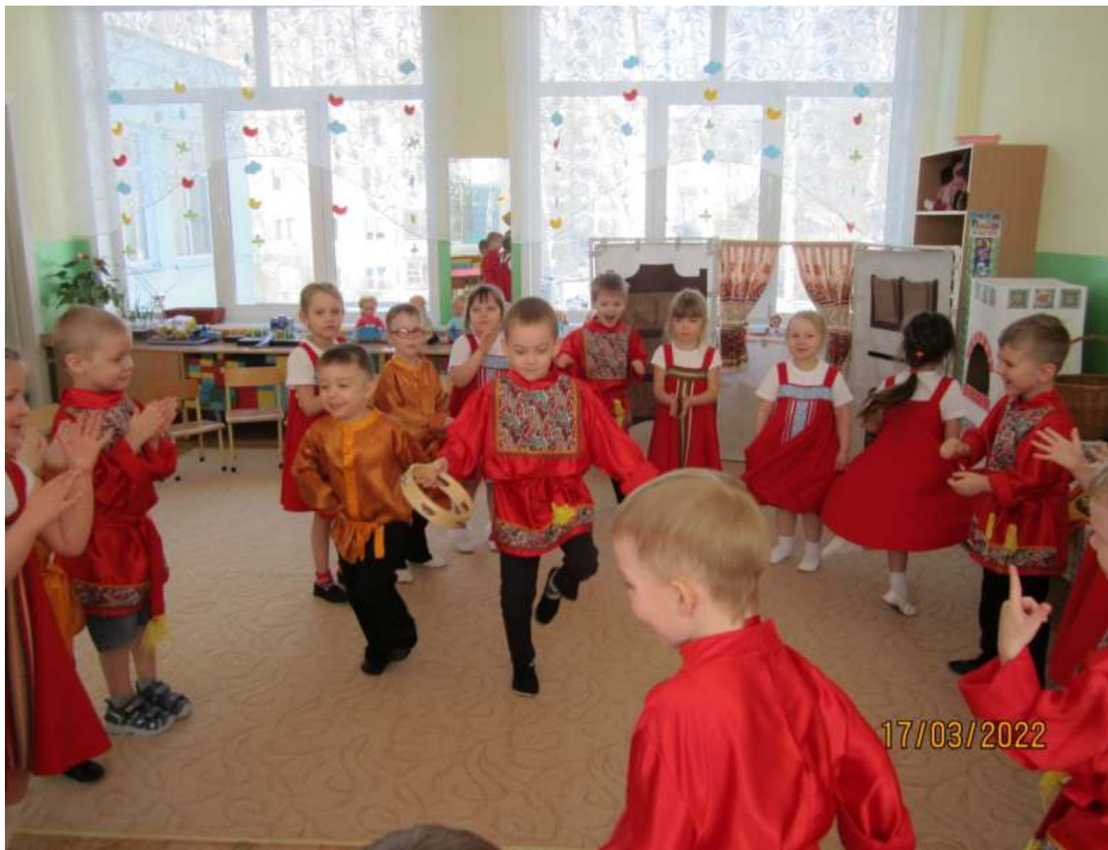
Народная игра «Веселый бубен»