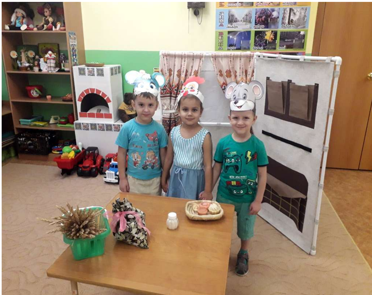
Театральная игра по сказке «Колосок»