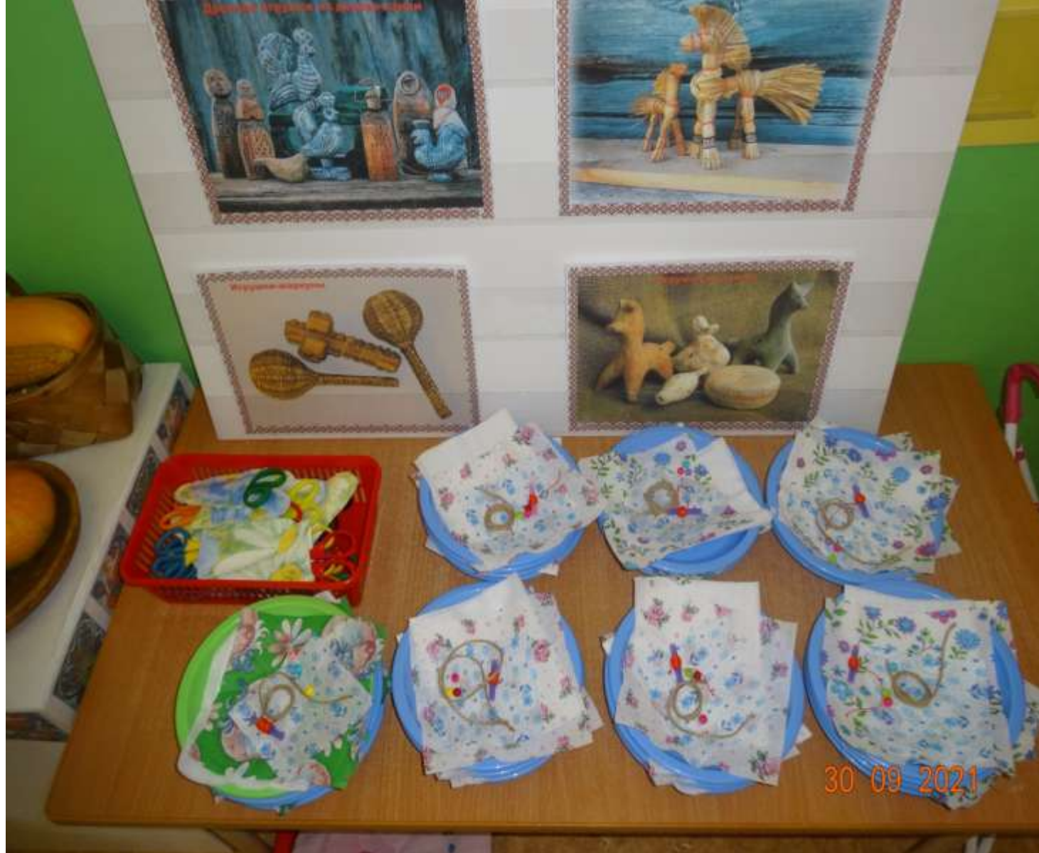
Мастер-класс на родительском собрании по кукле Теленашке