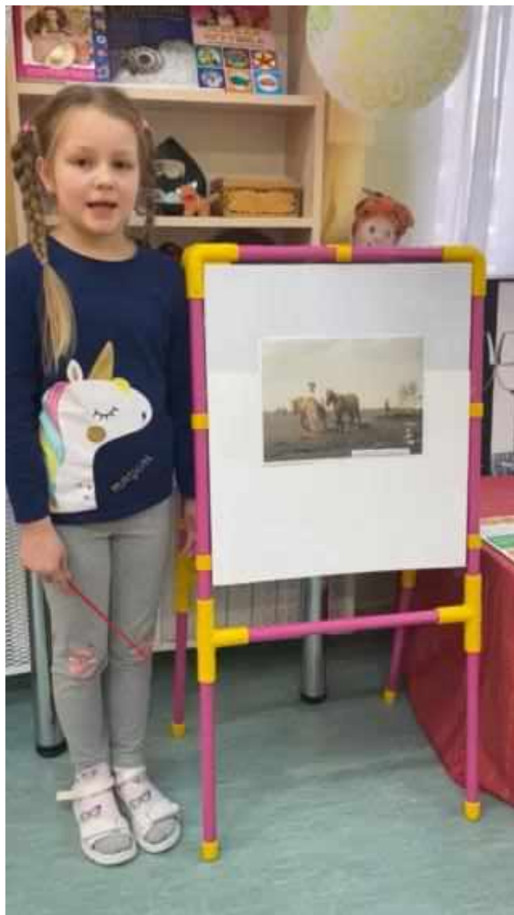
Описание картины А. Г. Венецианова "На Пашне. Весна"