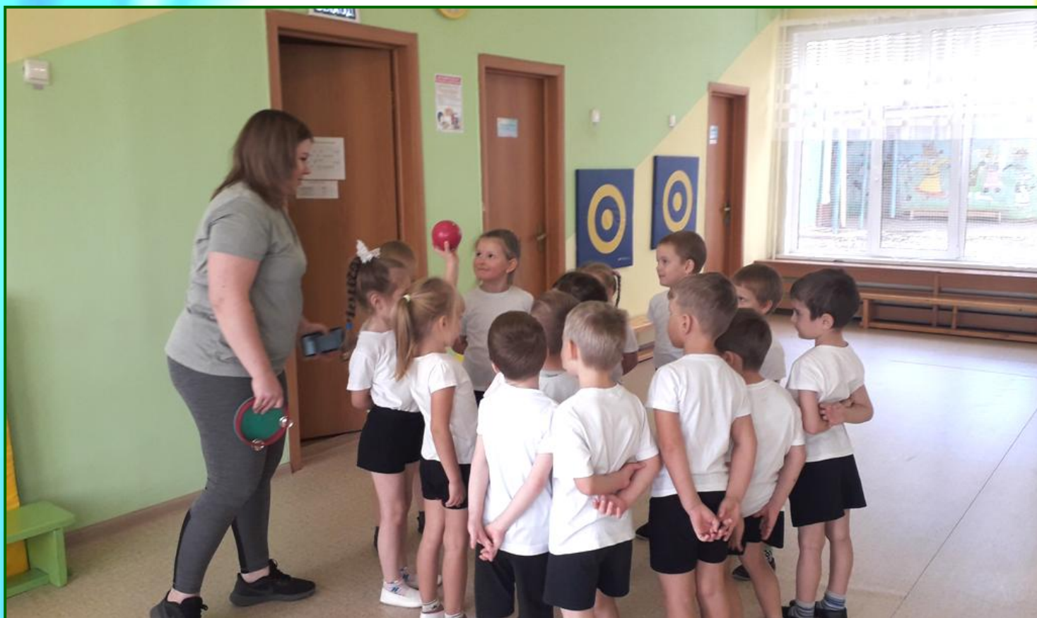
Игра «Угадай, у кого мяч?»