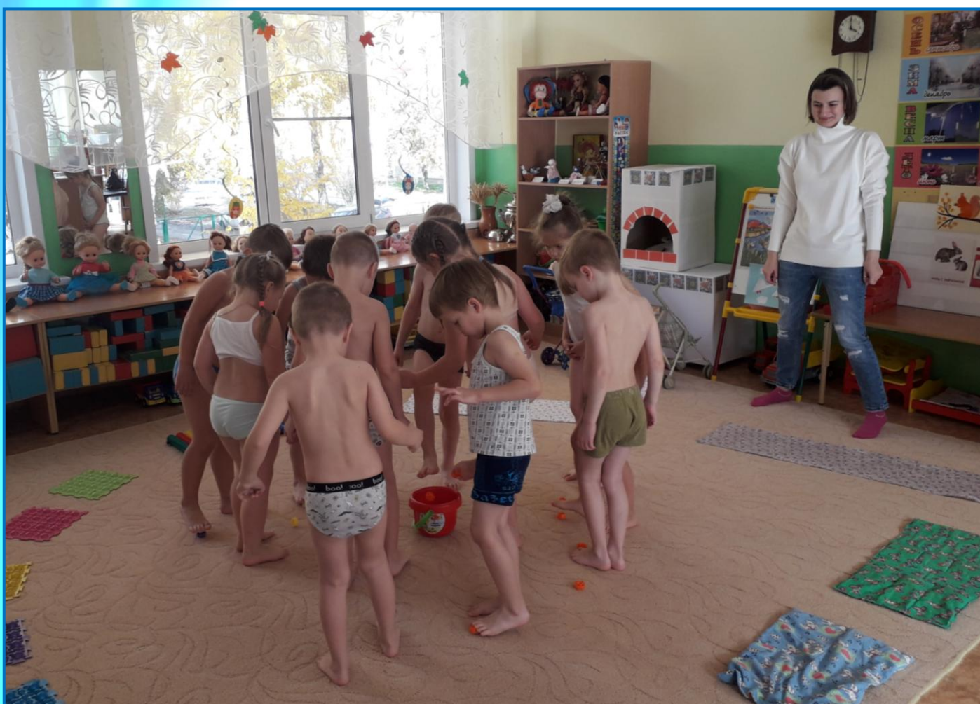
Корригирующее упражнение на профилактику плоскостопия «Собери камешки пальцами ног»