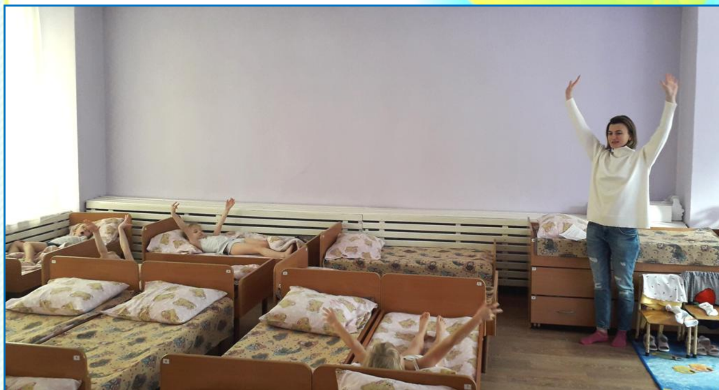
Упражнения в постели