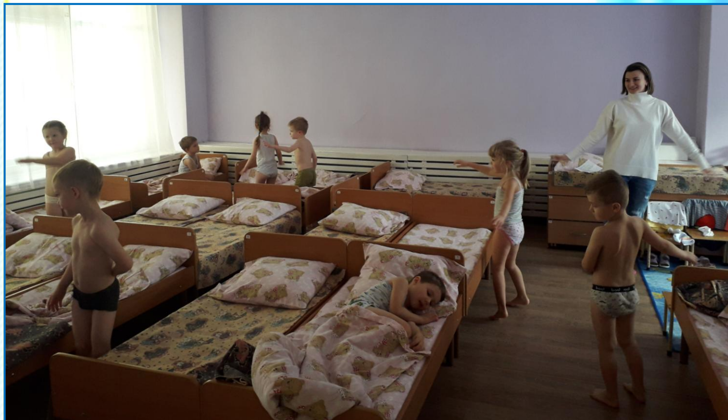
Упражнения выполняются стоя, у кроваток