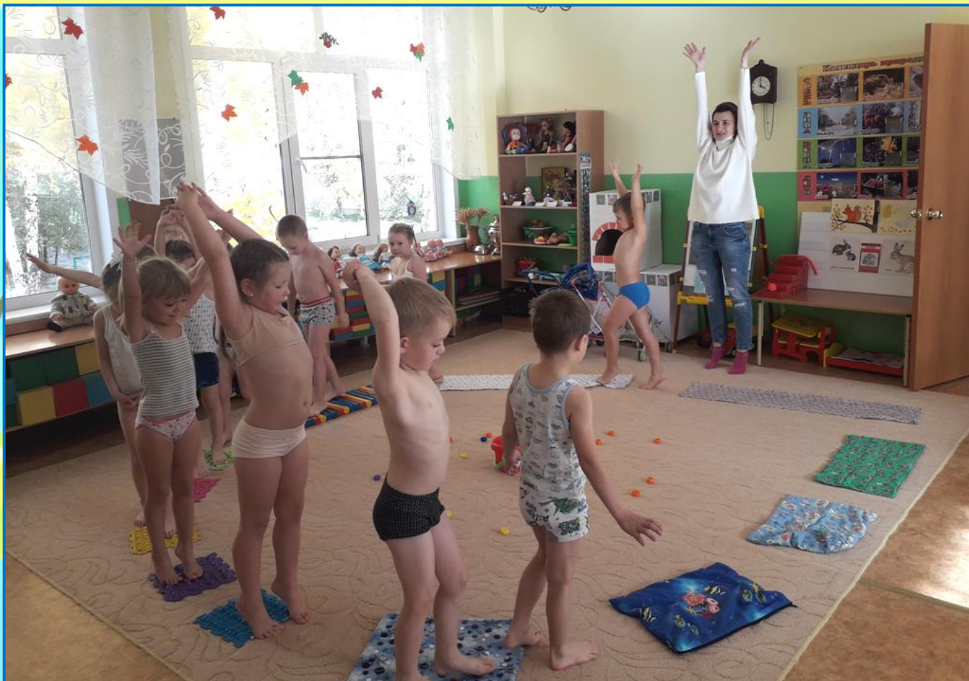
Ходьба по массажным дорожкам