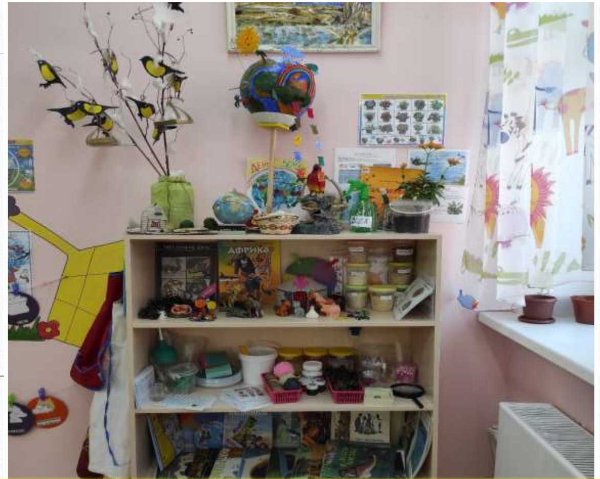
Уголок природы и экспериментирования