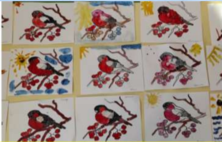
Пластилинография «Снегири прилетели»