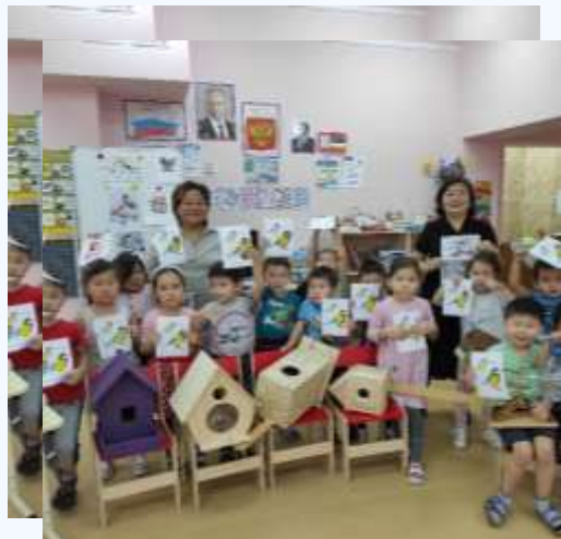
готовы наши кормушки и скворечники.