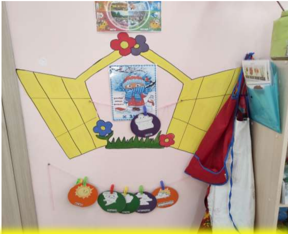
Каждое утро с детьми ведется работа с окошком погоды