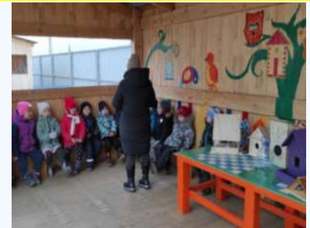
Целевая прогулка «Мы заботимся о птицах» Дети читают стихи и отгадывают загадки