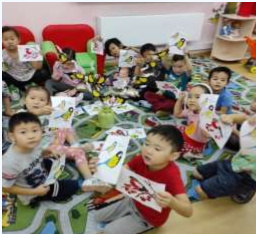
Теперь мы знаем много о пернатых друзьях