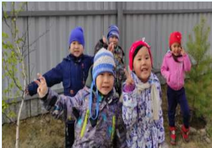
Целевая прогулка «Что растет на территории нашего сада»