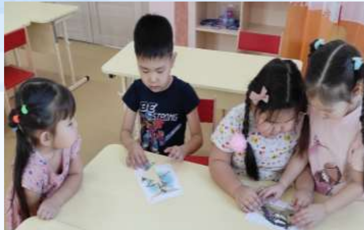
Дидактические игры «Пернатые друзья»