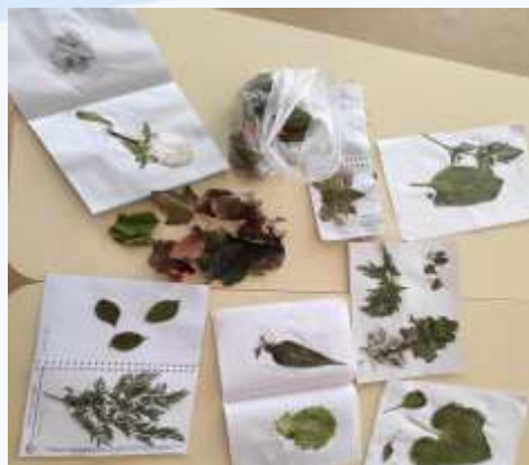
Какие травы растут у нас во дворе?