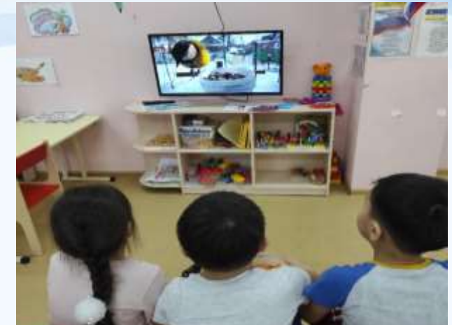
Просмотр фильма «Зимующие птицы»