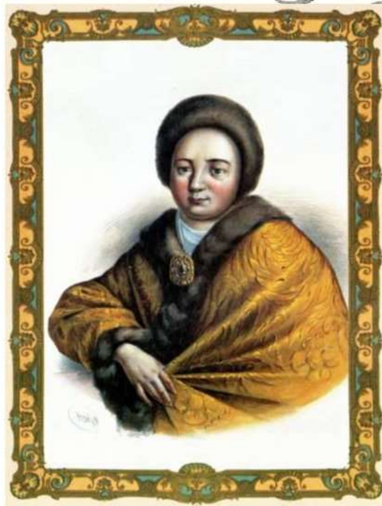
Мать Наталья Кирилловна Нарышкина