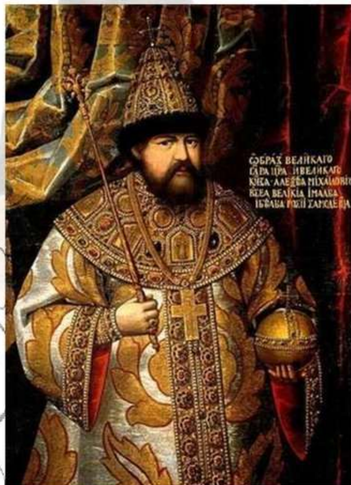
Отец царь Алексей Михайлович