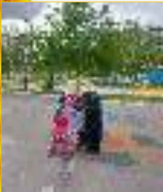
«Солнышко и дождик»