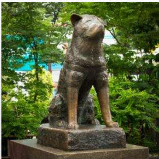
Памятник Хатико в Японии