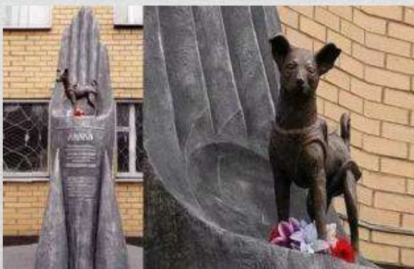
Памятник Лайке в Москве