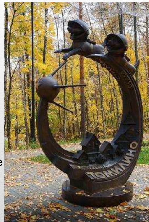
Памятник Белке и Стрелке в Москве