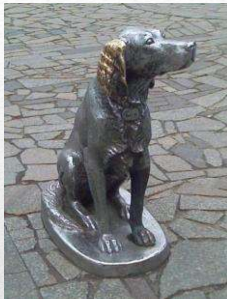
Белый Бим Черное ухо в Воронеже