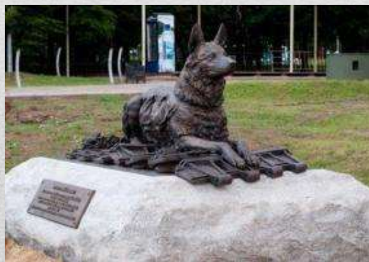
Памятник Джульбарсу в Москве