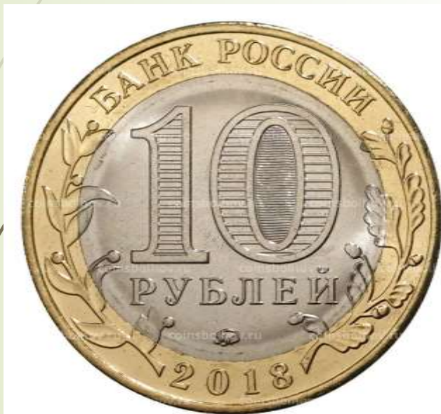
Аверс (лицевая сторона)

Мы с вами уже знаем, что на каждой монете обозначен её номинал, то есть покупательная сила. А что же на бумажных деньгах?