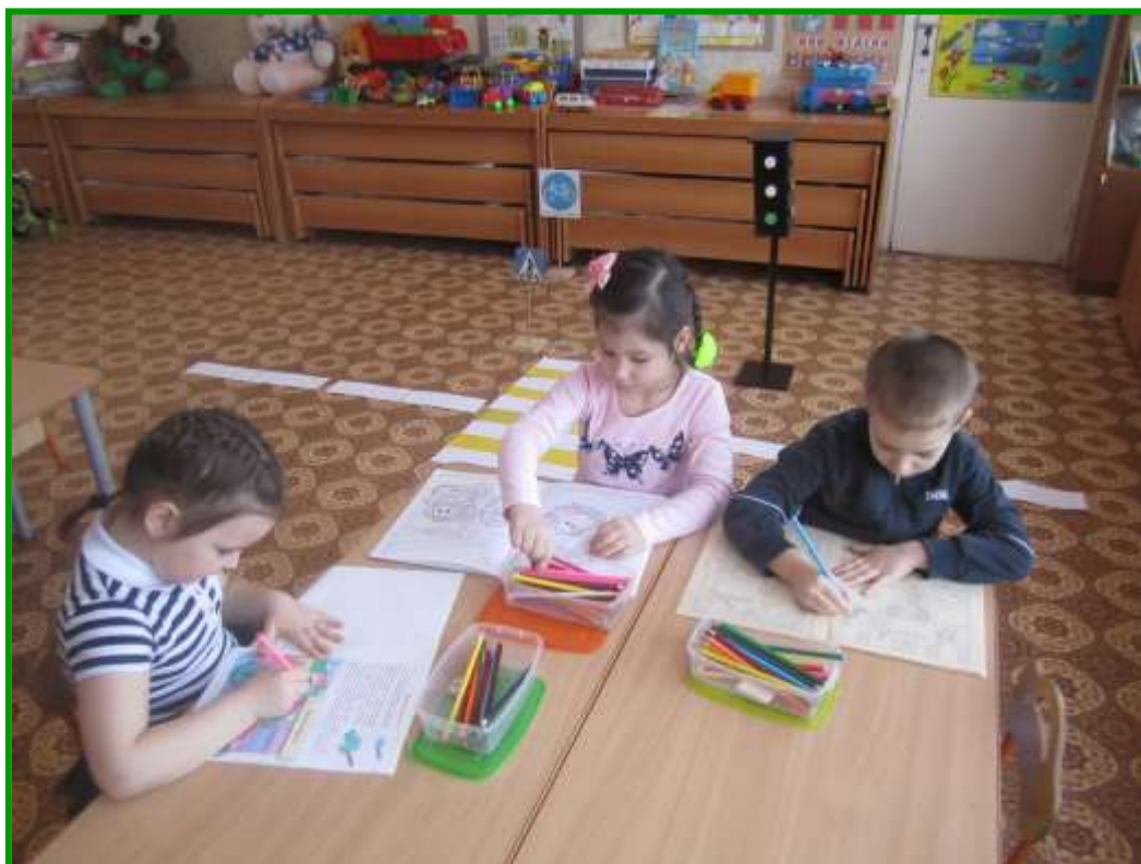
РАСКРАШИВАНИЕ РАСКРАСОК «ТРАНСПОРТ»