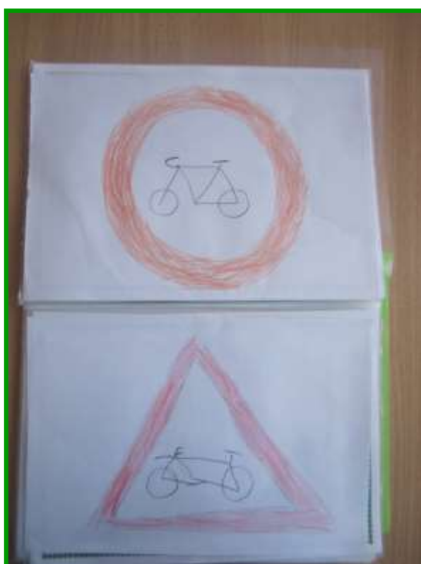
РИСОВАНИЕ. ДОРОЖНЫЕ ЗНАКИ ДЛЯ ВЕЛОСИПЕДИСТА ДЛЯ ДЕТЕЙ СТАРШЕГО ВОЗРАСТА