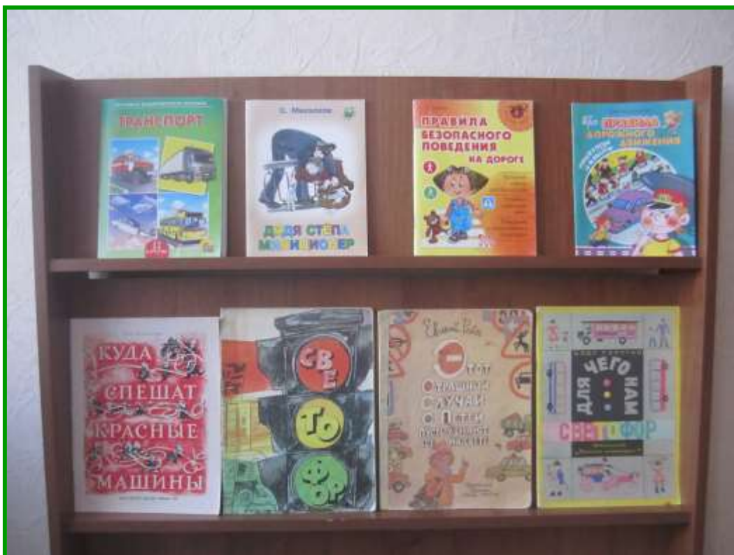
ВЫСТАВКА КНИГ В ГРУППЕ ПО ТЕМЕ «АЗБУКА ДОРОЖНОГО ДВИЖЕНИЯ»