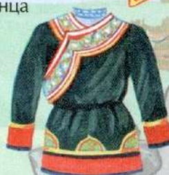
халат тэгэ удэгейский