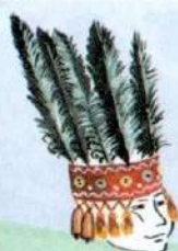
убор шамана (Тува)