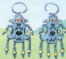
серьги: серебро, жемчуг, драгоценные камни