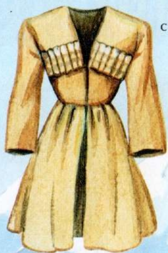
черкеска с газырями