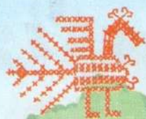
русский узор «птица»