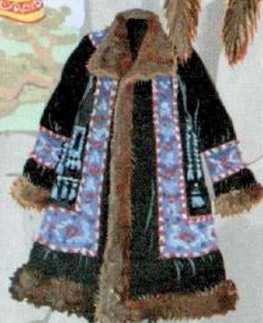
свадебная якутская шуба