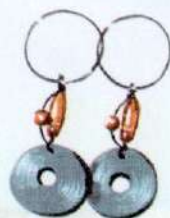
серьги с камнем