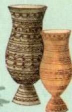
чороны для кумыса