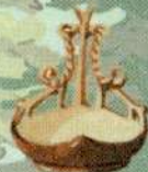
башкирский деревянный ковш