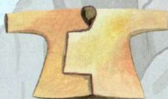
кыстан войлочная куртка охотника-тувинца