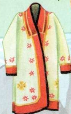
башкирский мужской халат