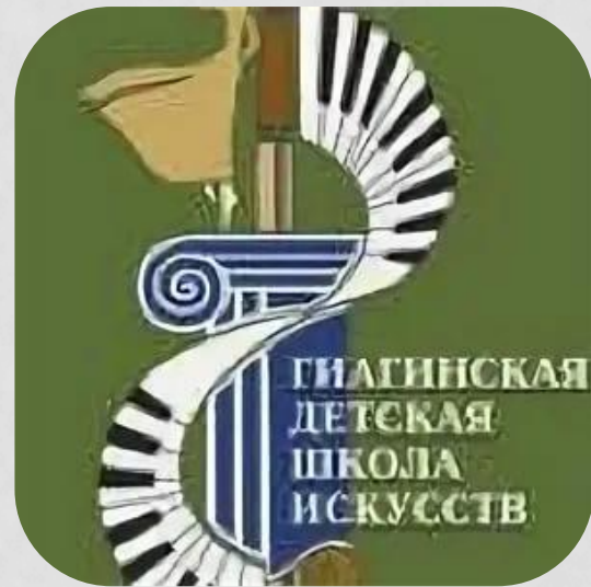
Гиагинская детская школа искусств