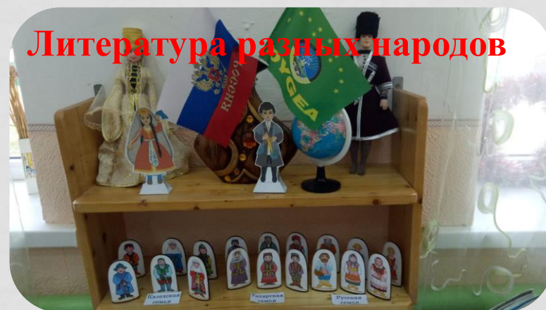
Литература разных народов