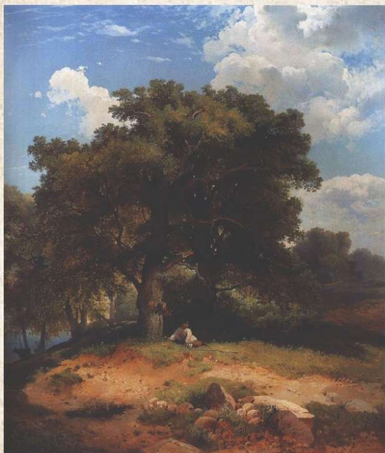
"Пейзаж с дубами и пастушком", 1860

-Нечего в классах киснуть! Скорее, скорее за город! Там уже дуб цветет, небо синее, совсем весна. И на картинах своих Саврасов природу изображал. Такие картины называются «пейзажами», а Саврасов, выходит, был художником-пейзажистом.