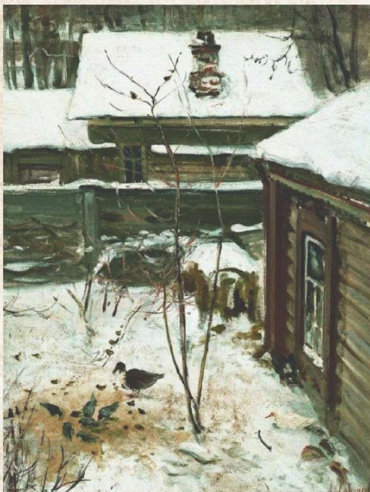
"Дворик. Зима" (1870-е, ГТГ).

Небо серое, неприветливое, вот-вот пойдет сыпать снегом или дождем. Деревья стоят голые, все какие-то кривые, будто от ветра скрючились. Дома вдоль дороги стоят - все маленькие, неказистые, соломенные крыши набок съехали ... А вон церквушка красивая, видно, что старинная, да вся краска облезла от непогоды. Нет, видно, у крестьян денег, чтобы ее покрасить да побелить. А за деревней поля раскинулись - так туда ни конному, ни пешему хода нет, грязь такая, что и шагу не ступишь. Остановился Саврасов... Что же делать-то? Ноги уже совсем промокли, ветер все сильнее да холоднее... На такой стуже кисточку в руках и не удержишь. Да и охоты нет -ни красками писать, ни карандашом рисовать: не годится такой вид для картины.