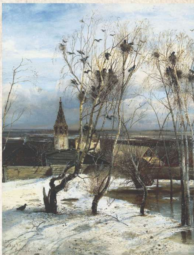
"Грачи прилетели", 1871

- Спасибо за уважение, художник, - важно ответил ему старый грач. - Мы ведь и правда, на крыльях Весну приносим. Сейчас она пошла своего дедушку Мороза навестить, но вот-вот вернуться уж должна. Совсем скоро тепло будет. Ну, до сентября! Уговор дороже денег. Встретимся на этом же месте. Взмахнули крыльями грачи и улетели.