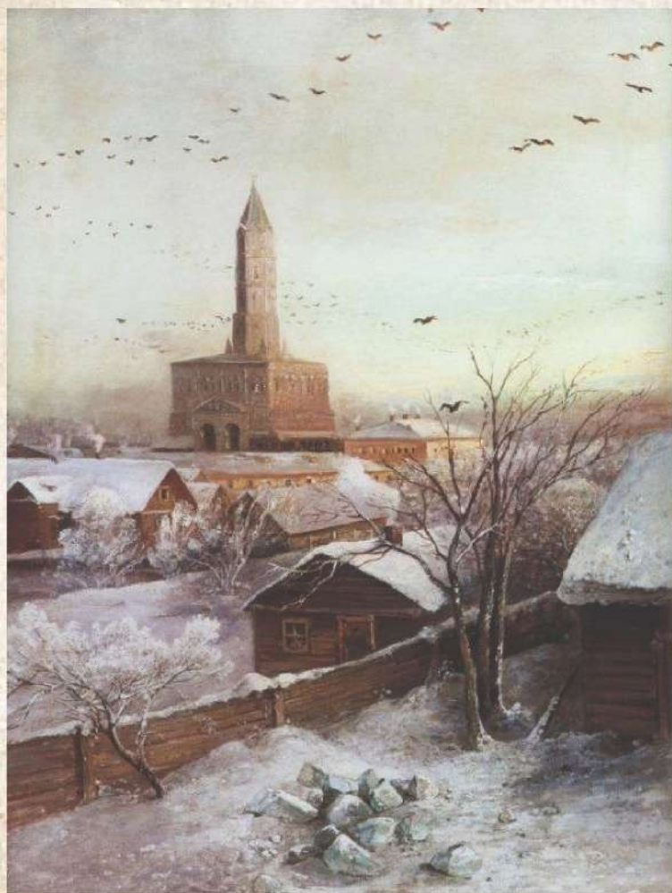
"Сухарева башня", 1872

- Да ведь оно волшебное, - сказал грач. - Посмотри-ка в него. Поднес Саврасов стеклышко к глазам,