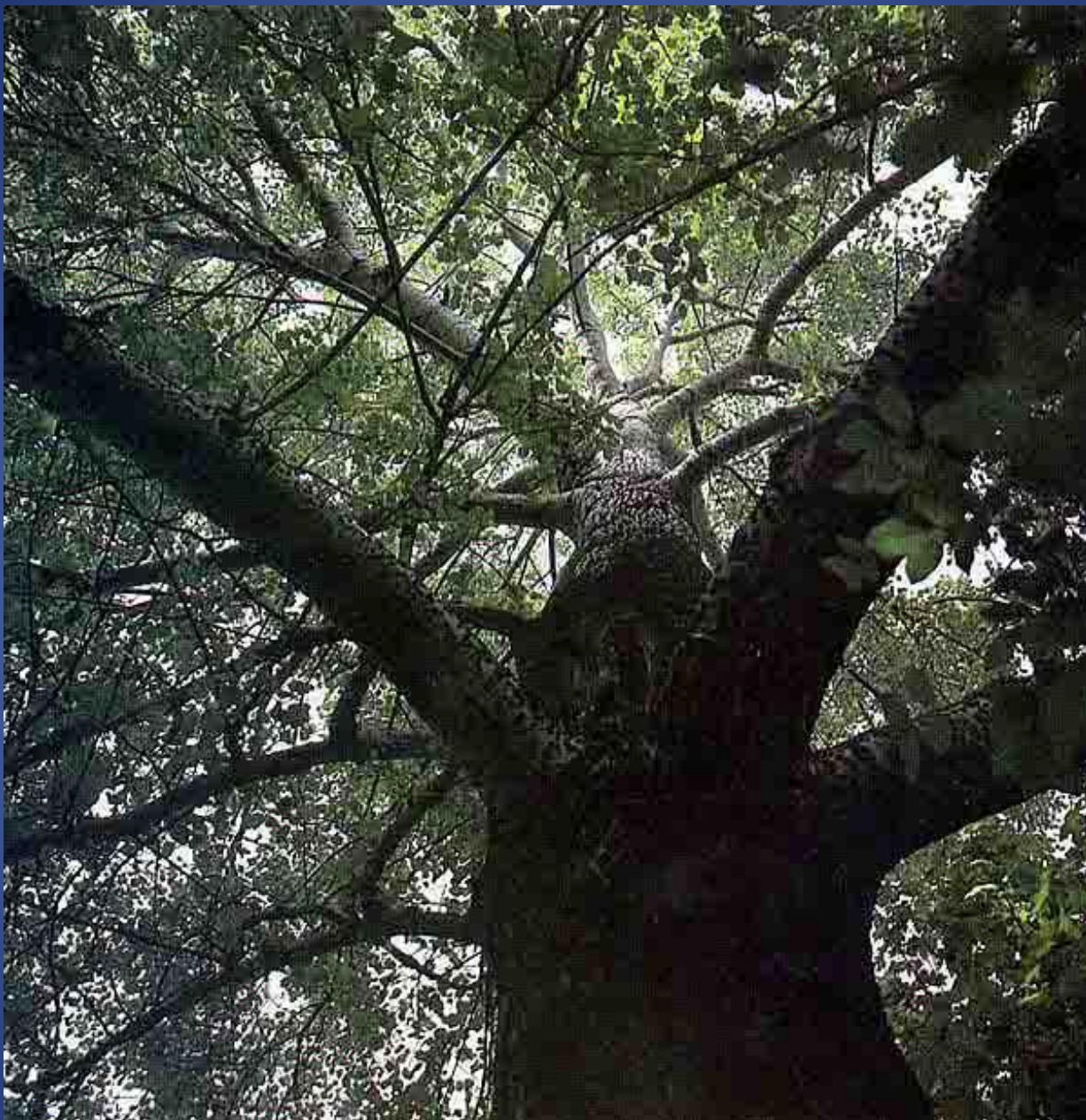
Толстый тополь у ворот