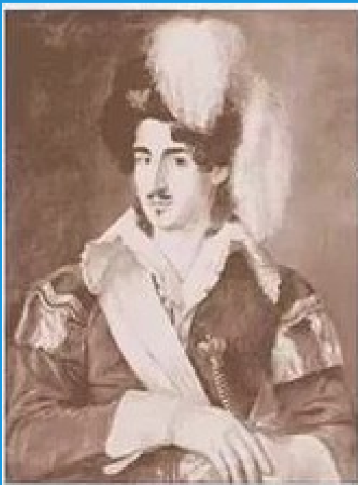
Николай Осипович Гольц 1800–1880 гг.

В России полька появилась в 1845 году. Этот танец, тогда очень модный во Франции, привёз из поездки в Париж знаменитый танцовщик императорской труппы Гольц: он поставил его на сцене, а потом распространил в великосветском петербургском обществе.