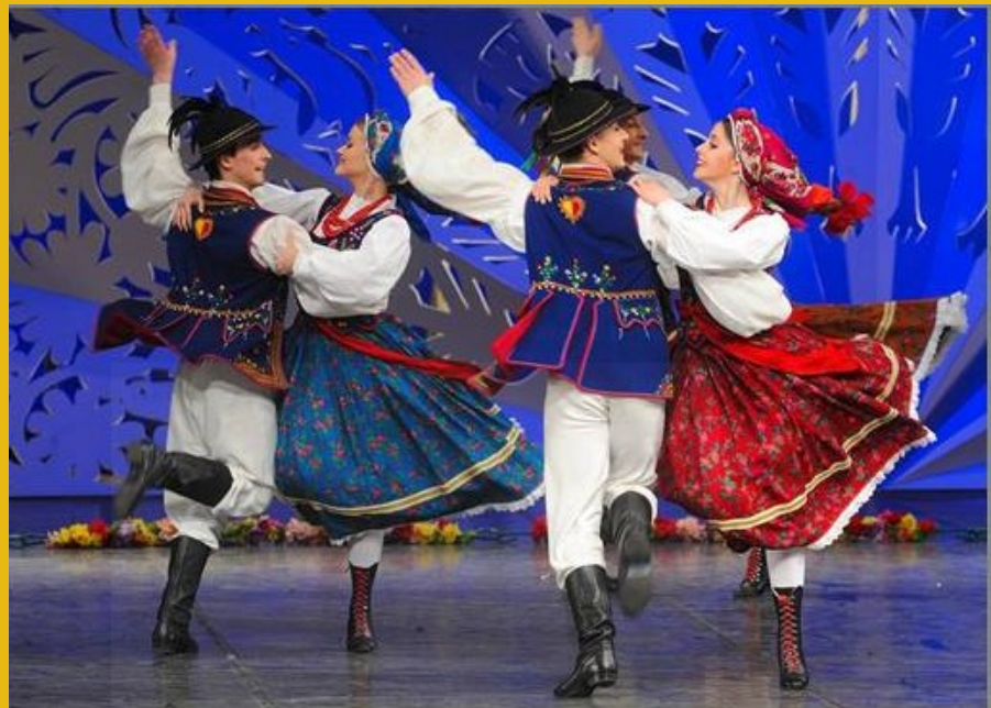
Чешский национальный костюм