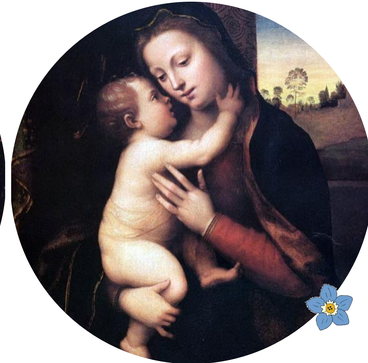
Мариотто Альбертинелли. Мадонна с Младенцем