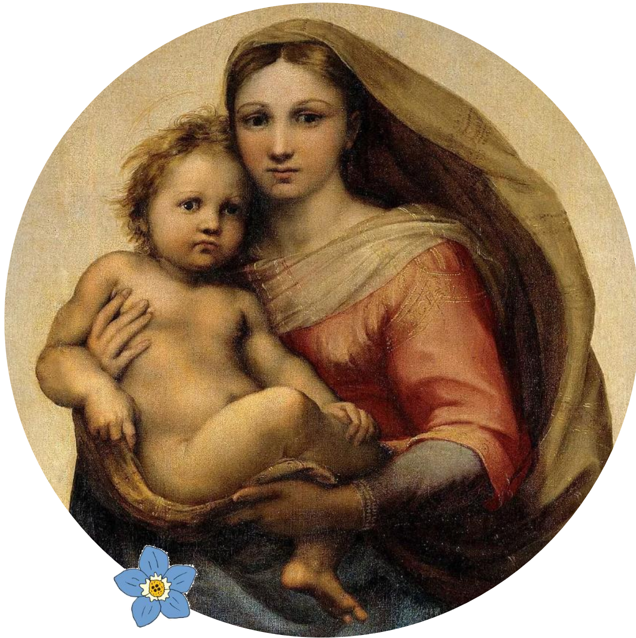
Рафаэль. Сикстинская мадонна

Образ матери всегда вдохновлял художников, писателей и поэтов