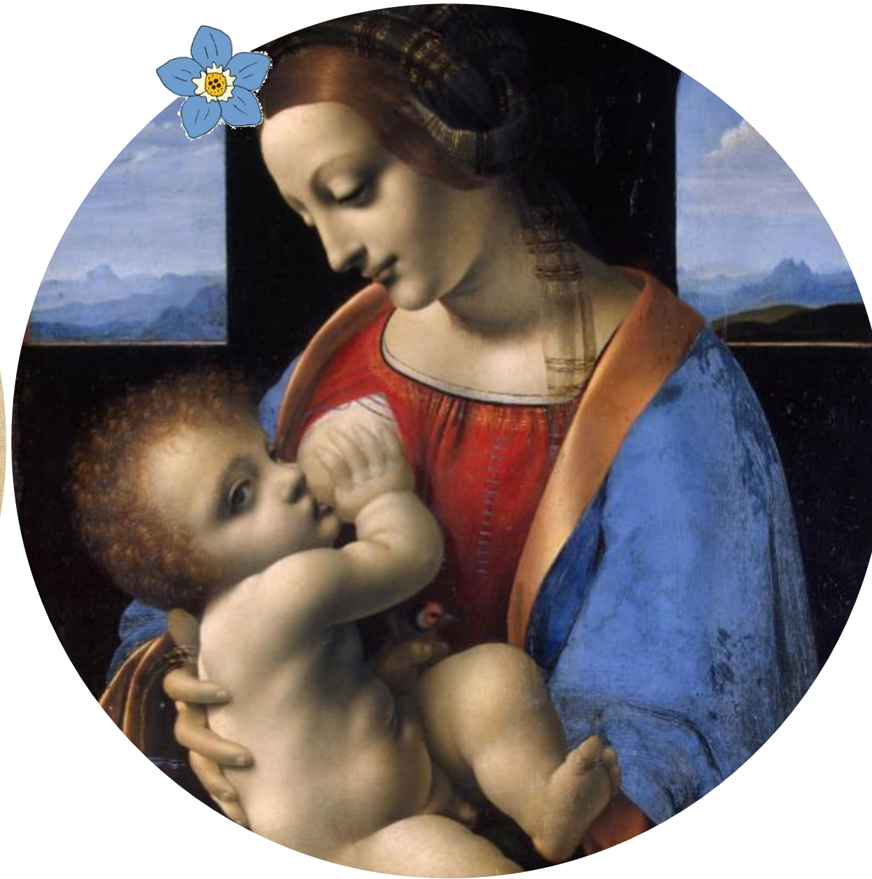
Леонардо да Винчи. Мадонна Литта