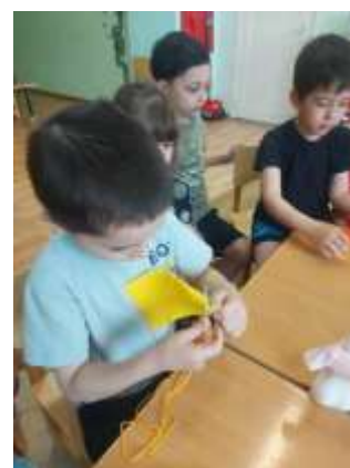
Домашнее задание. «Моя мама мой наставник».