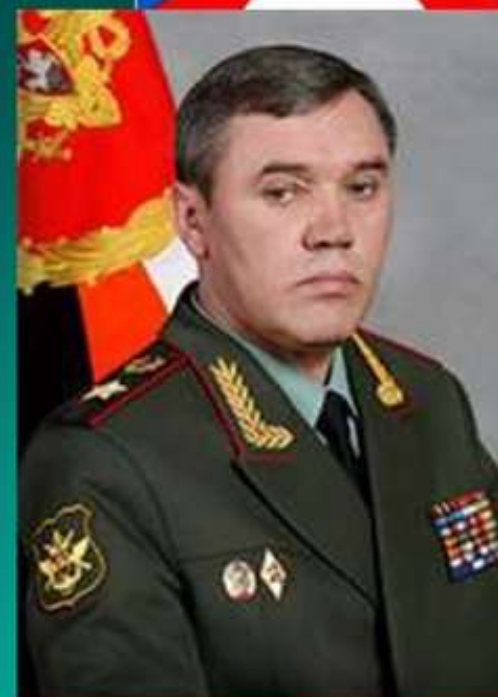
Герасимов Валерий Васильевич