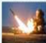
Войска противовоздушной обороны