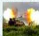
Ракетные войска и артиллерия