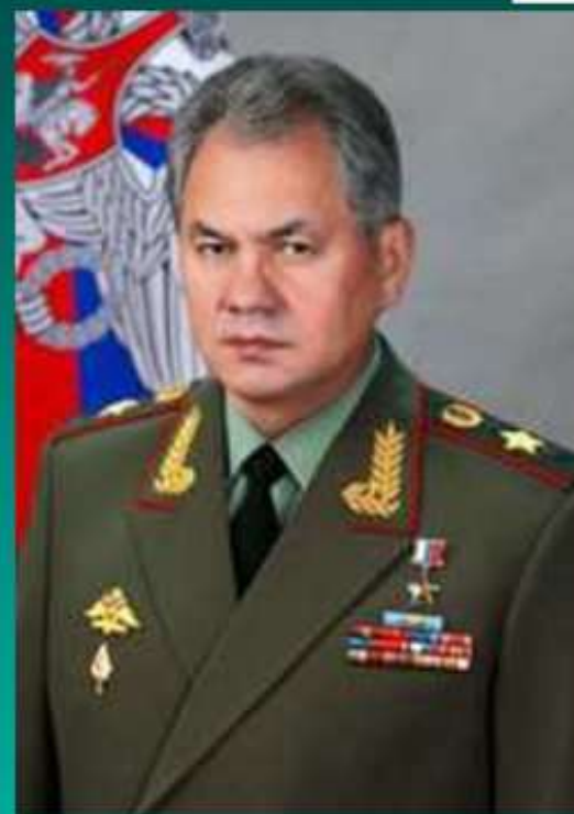
Шойгу Сергей Кужугетович Министр Обороны России, генерал армии Герой России Федерации