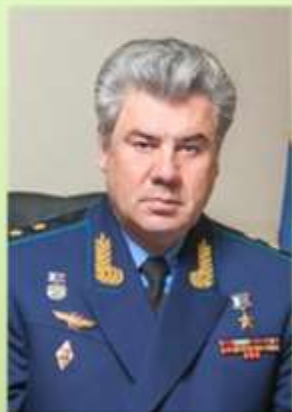
Главнокомандующий Воздушно-космическими силами Генерал-полковник Бондарев Виктор Николаевич