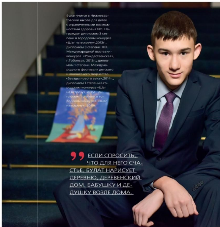
МЕСТО ГОСТИНИЦА «ЮБИЛ»

„ ЕСЛИ СПРОСИТЬ, ЧТО ДЛЯ НЕГО СЧАСТЬЕ, БУЛАТ НАРИСУЕТ ДЕРЕВНЮ, ДЕРЕВЕНСКИЙ ДОМ, БАБУШКУ И ДЕДУШКУ ВОЗЛЕ ДОМА.