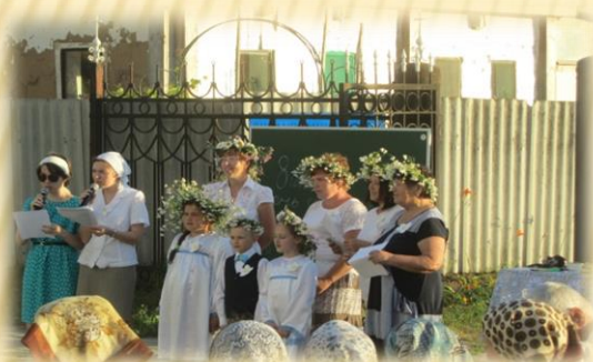
День семьи, любви и верности