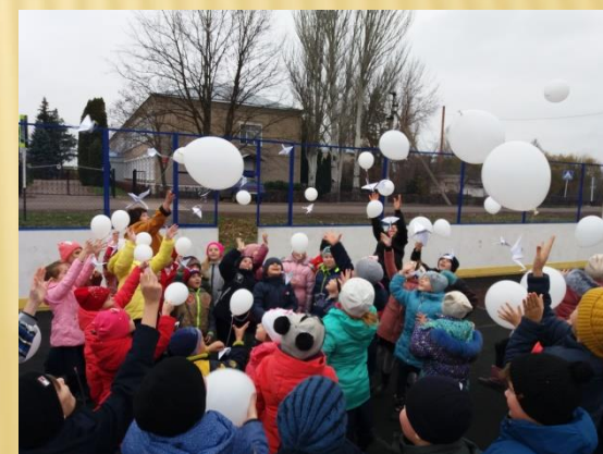
День неизвестного солдата