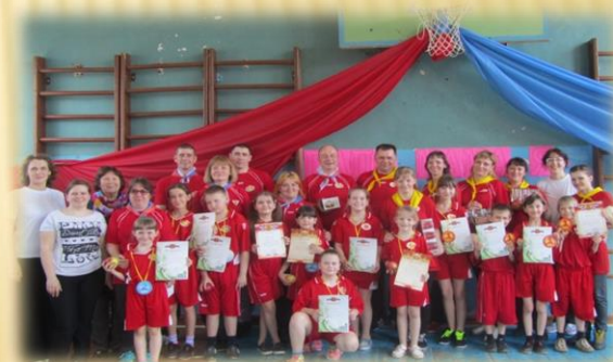
«Папа. Мама, Я- спортивная семья»