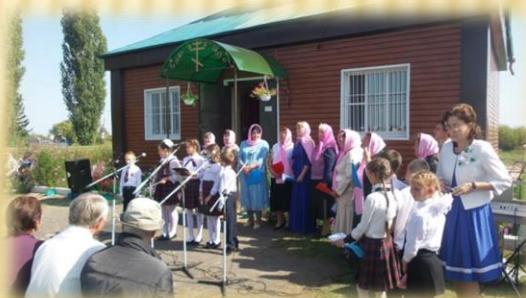
Престольный праздник Александро- Невского храма