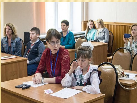
Край Воронежский православный

Мероприятия создают условия для духовно – нравственного, патриотического воспитания каждого ребенка