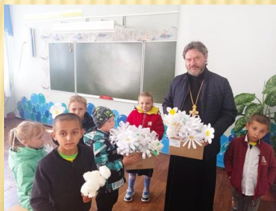
Благотворительная акция белый цветок