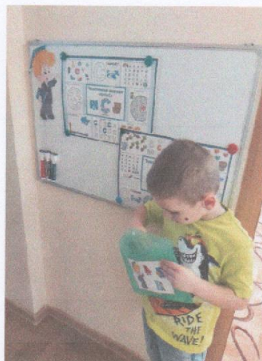
Конверт с заданиями от Грамотейки