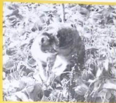
Наш полосатый гость.