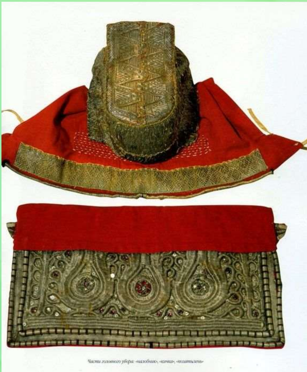
Части головного убора: «налобник», «кличка», «подпоясник»