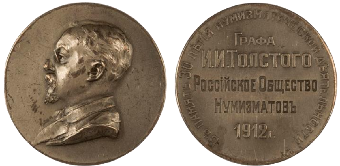
Жетон в память 30-летия нумизматической деятельности графа И.И. Толстого (1912)