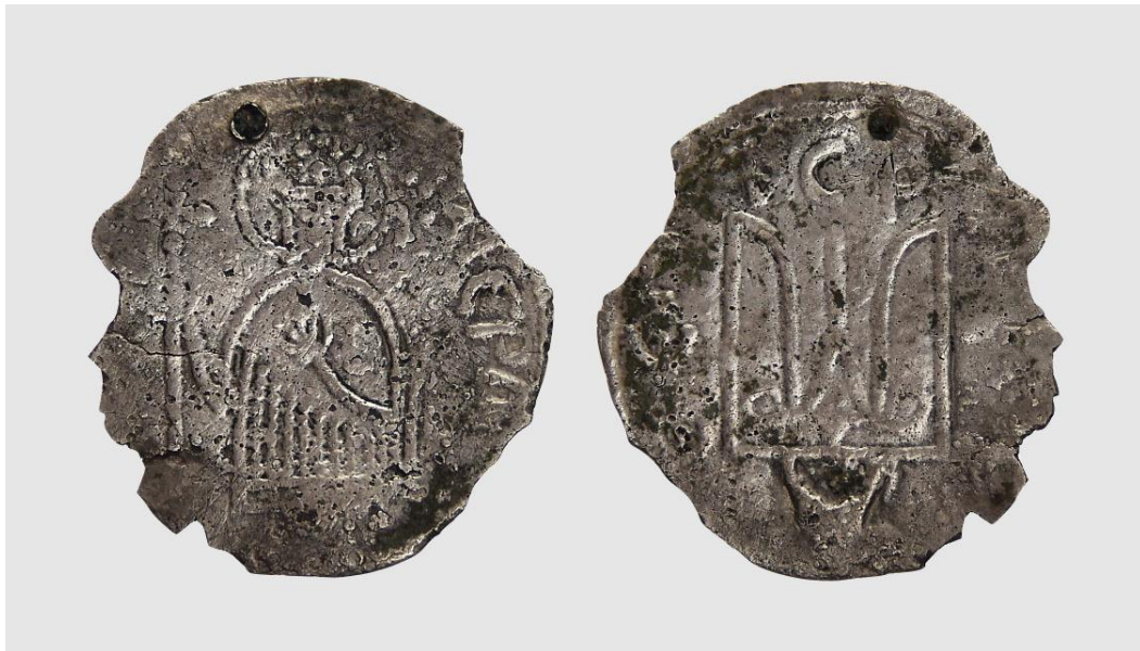
Сребреник князя Владимира (X век)

Одним из немногих нумизматов XIX века, владевших редкими экземплярами монет времён князя Владимира, был граф Иван Толстой. В его коллекцию они попали в 1876 году после находки клада. Иван Толстой дал «безымянным» древнерусским монетам названия «златники» и «сребреники», которые после стали использоваться и научным сообществом.