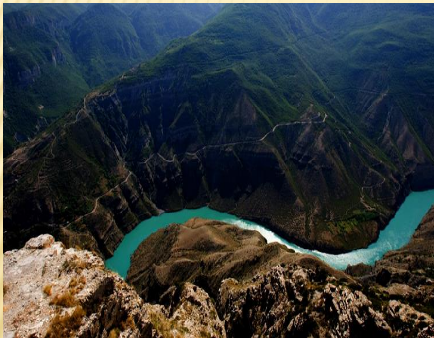
✕ Сулакский каньон