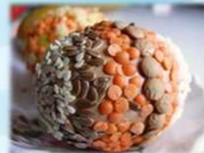
С использованием семян