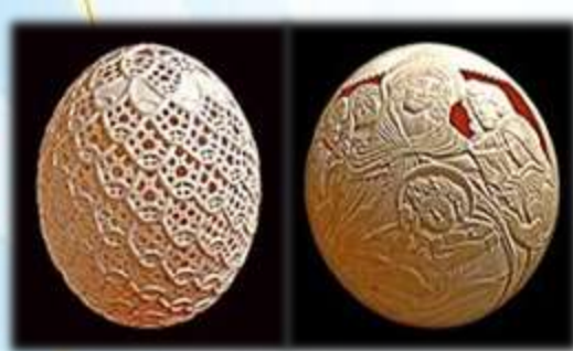
Вырезание по яичной скорлупе