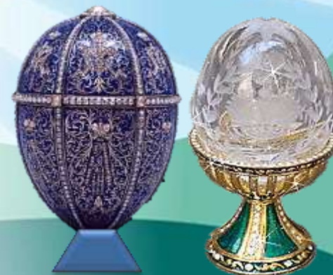
Из фарфора и хрусталя, золота и серебра, из цветного и прозрачного стекла, из кости и камня...