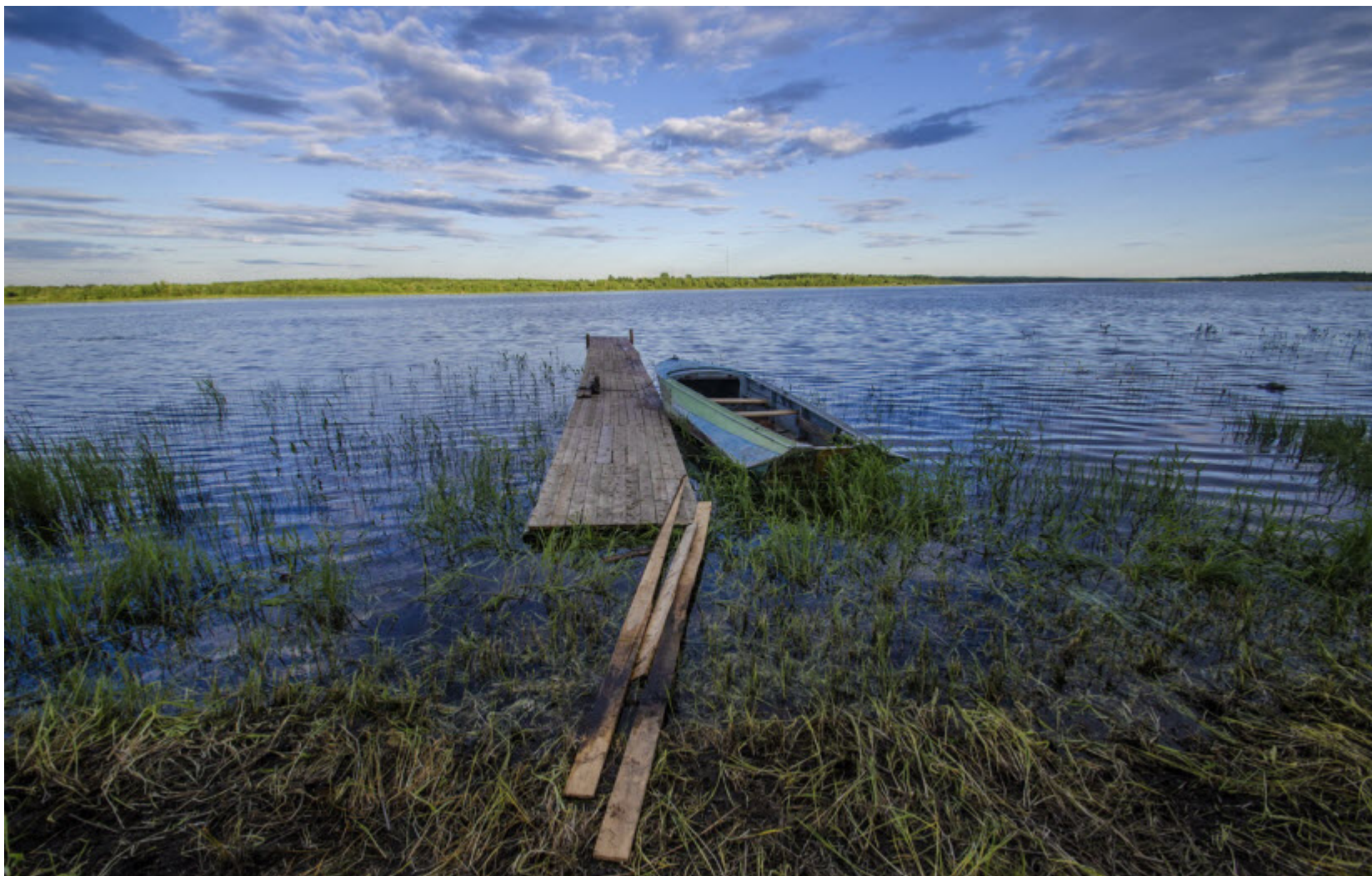
Река Онега и Онежские ключи