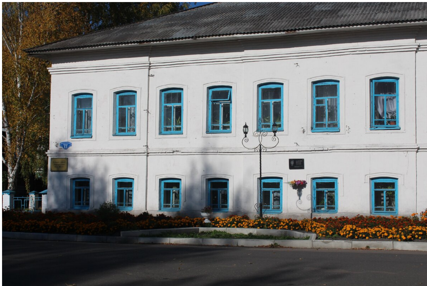
Сольвычегодская библиотека, Литературная усадьба Козьмы Пруtkова.