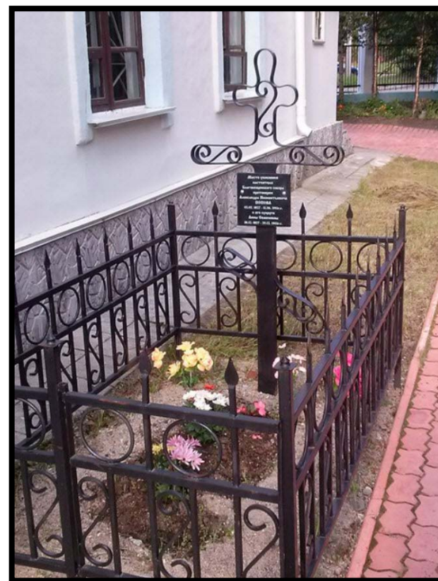
Крест протоиерея А.И. Попова.

У стены Благовещенской церкви стоит крест на месте захоронения протоиерея А.И. Попова. Священник служил настоятелем Кольского храма целых пятьдесят лет. Надгробный крест, разрушенный в советское время, был восстановлен в 2012 году.