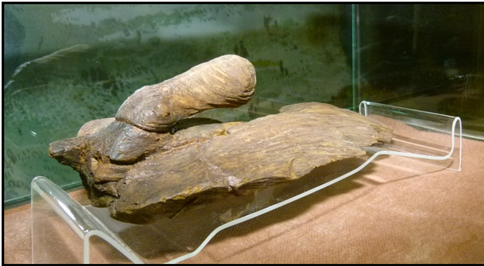
Фрагмент «лыжи Йиркапа» с загадочной деталью, которая, по мнению ученых, не давала лыжам скатываться назад при подъеме в гору.