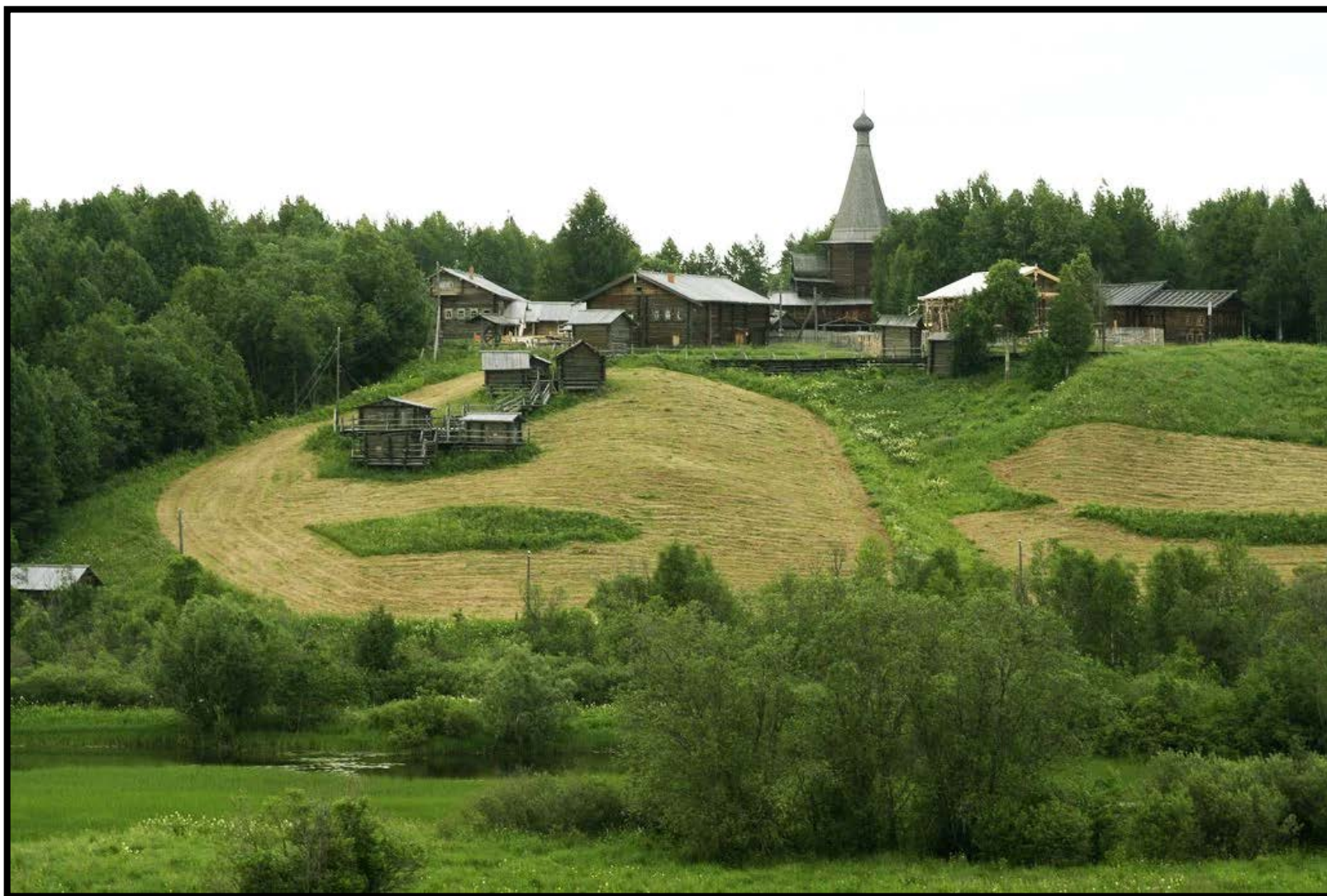
Вид на музейный комплекс (Мезенский сектор)