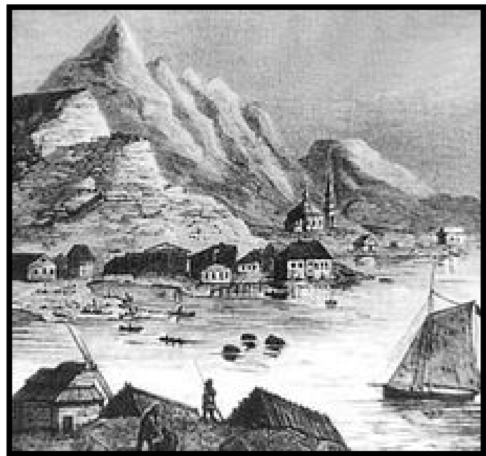
Кандалакша на гравюре Н. Н. Каразина

Кандалакша является самым южным из всех городов региона. Город находится на побережье Кандалакшского залива Белого моря, в устье реки Нива, в 200 км к югу от Мурманска