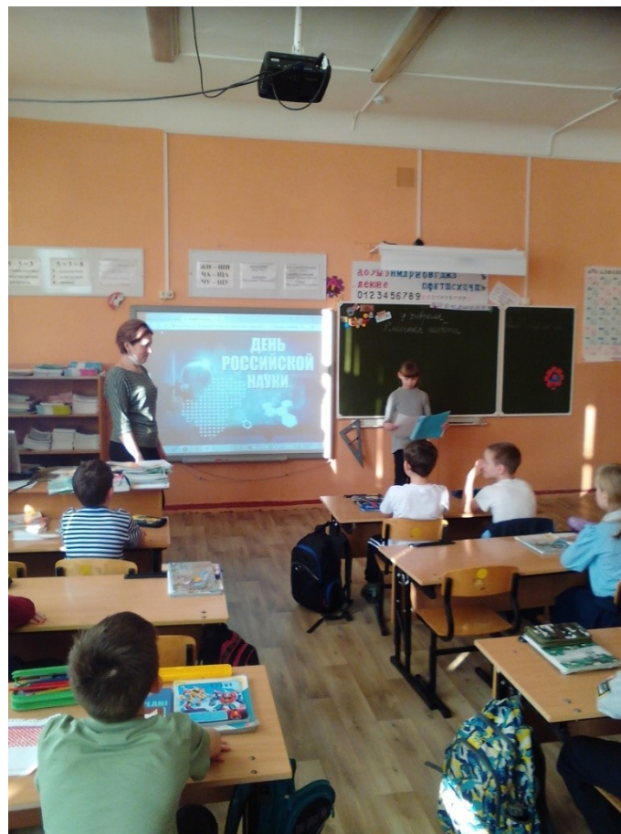
День российской науки