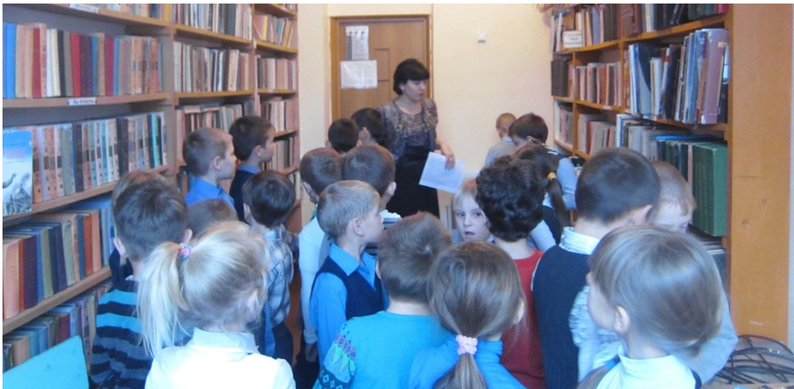
Квест-игра для учеников 3 класса "История народов Красноярского края»