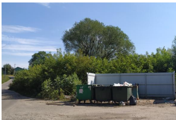
Фото 3. Контейнеры для ТБО д.Кукуевка