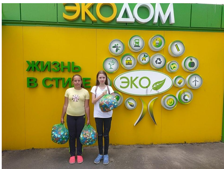
Пункт приёма крышечек в г.Курске (ул. Сумская, 46)