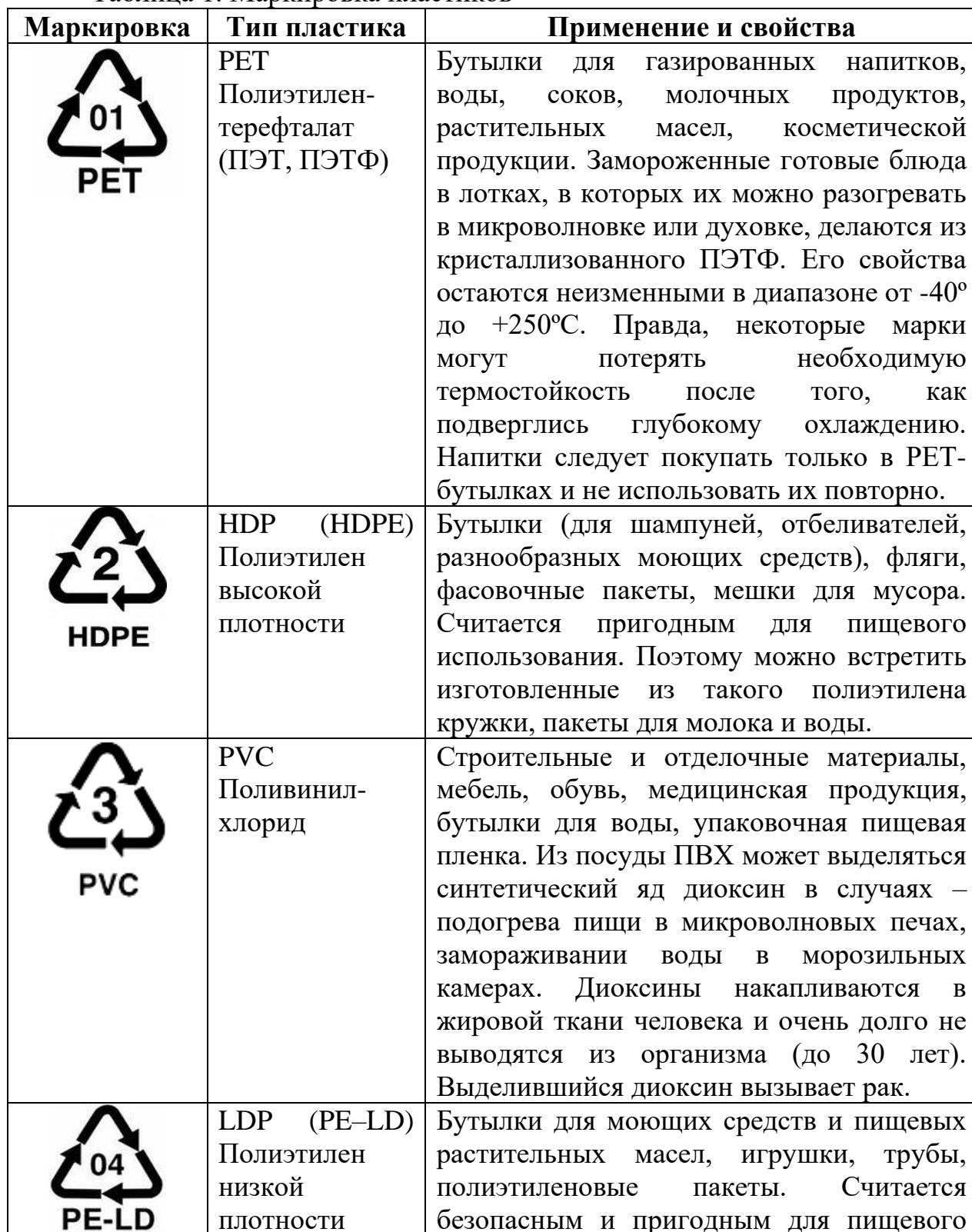
Таблица 1. Маркировка пластика

Рассмотрим маркировку пластика и их применение в быту [1]