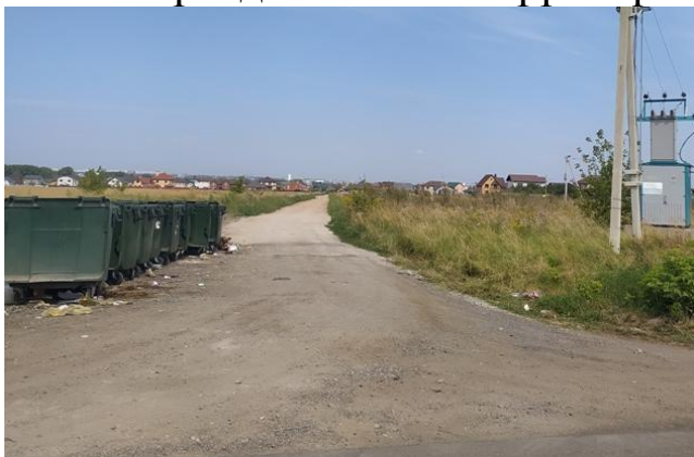
Фото 1. Контейнеры для ТБО д.Кукуевка