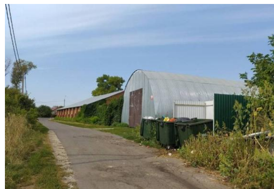
Фото 4. Контейнеры для ТБО д.Новопоселеновка