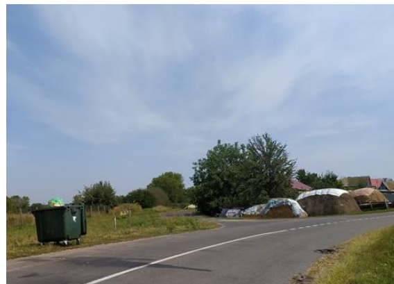
Фото 6. Контейнеры для ТБО д.Селиховы Дворы