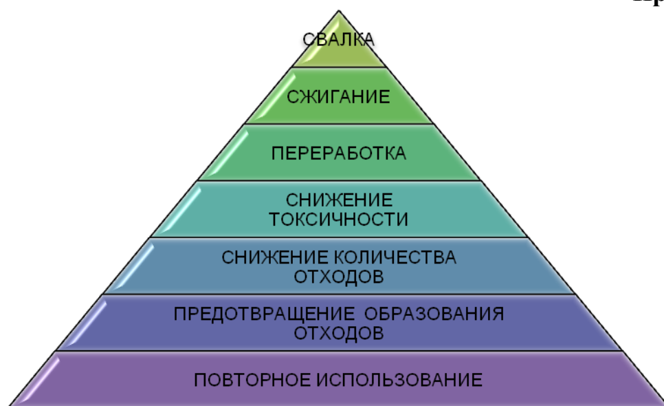
Диаграмма 1. Иерархия обращения с отходами в будущем.