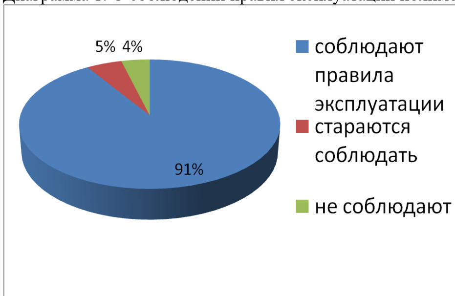
Диаграмма 1. О соблюдении правил эксплуатации полимерных отходов