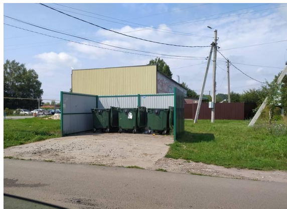
Фото 2. Контейнеры для ТБО д.1-е Цветово