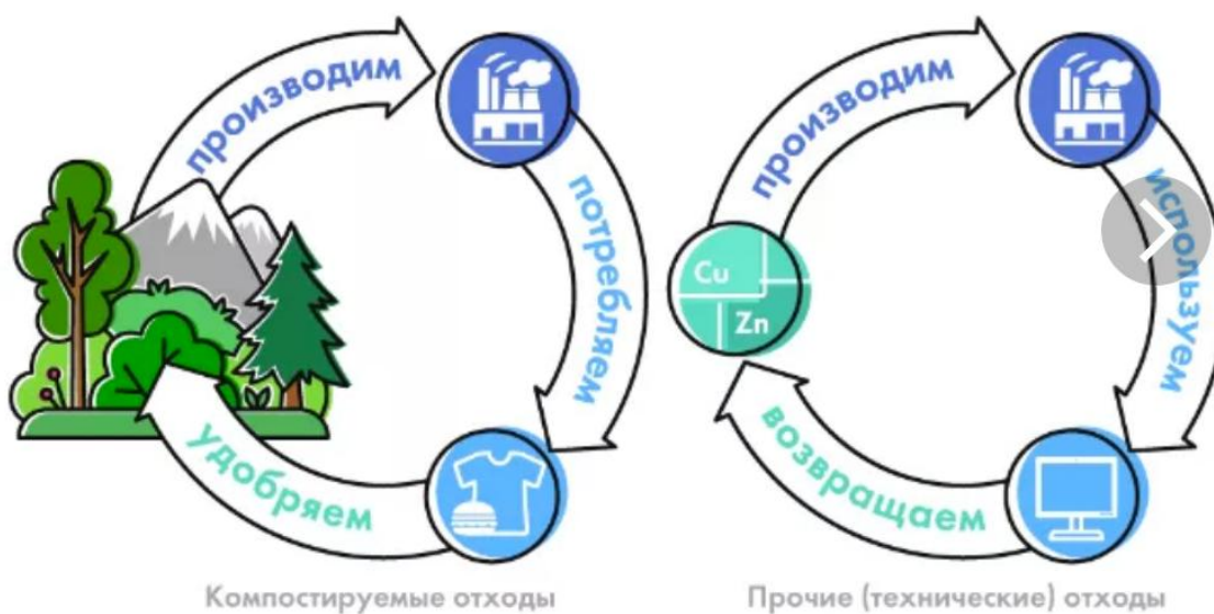
Рис.2. Циклическая экономика