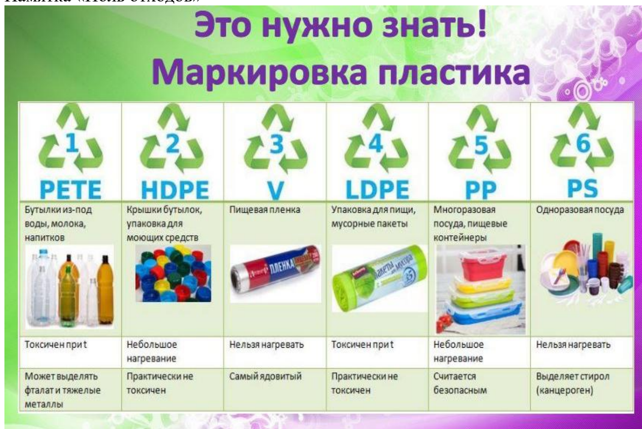
Бюллетень «Это нужно знать! Маркировка пластика»