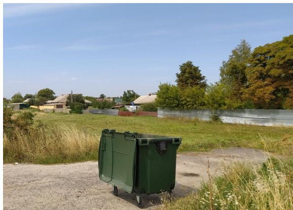
Фото 5. Контейнеры для ТБО д.Берёзка