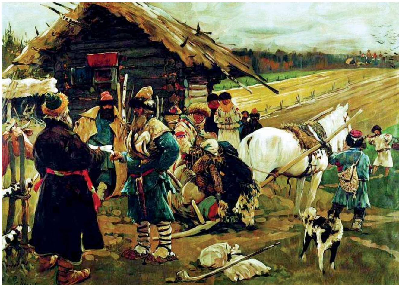
Отъезд крестьянина от помещика в Юрьев день. С. Иванов, 1908 г.

Типологические картины – отражают явления, типичные для определенной исторической эпохи.