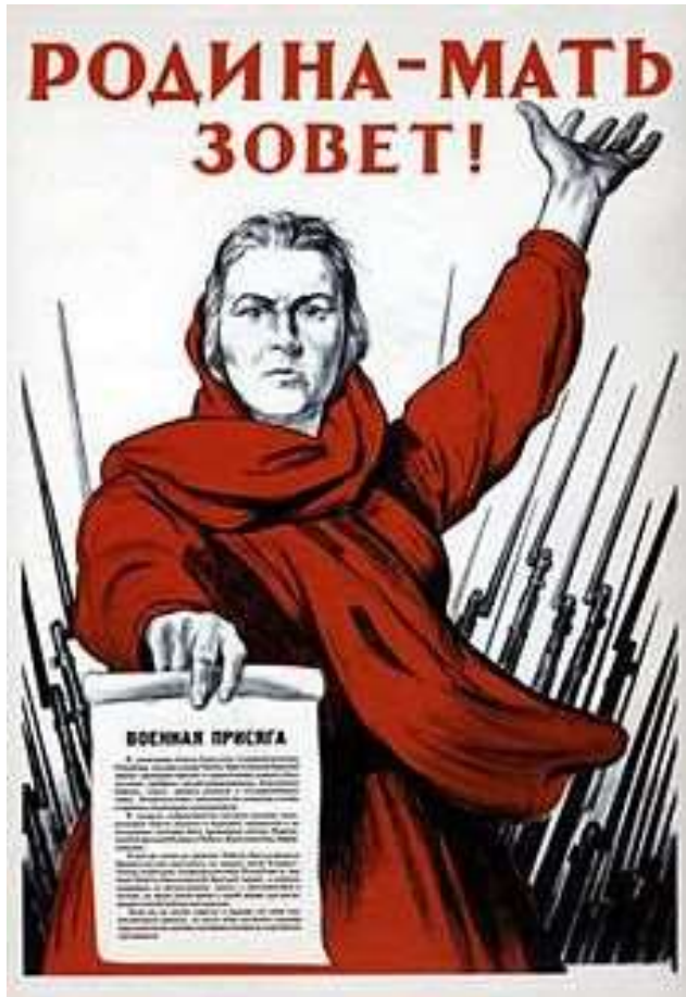
«Родина – мать зовет!», И. Тоидзе, 1941 г.

ВПр по истории, 7 класс. Часть 2 Рассмотрите изображение и выполните задание.