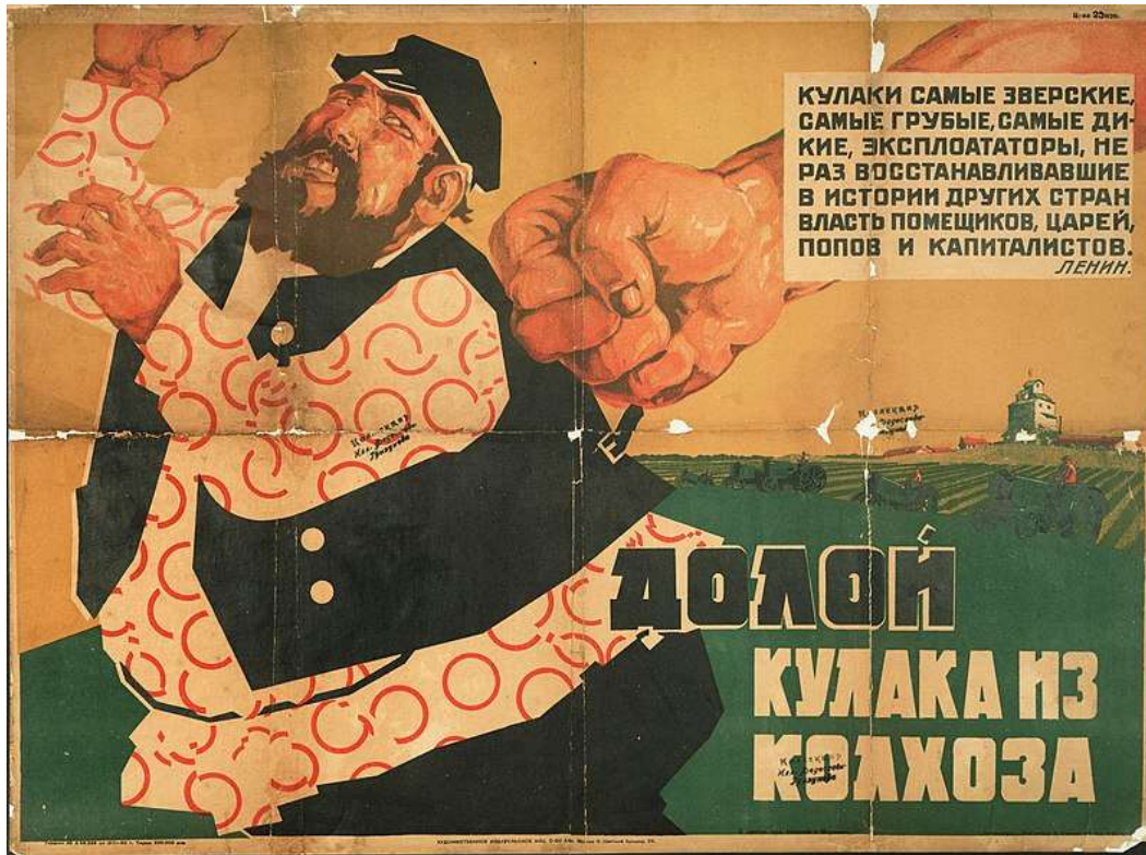
Долой кулака из колхоза, 1930 г.