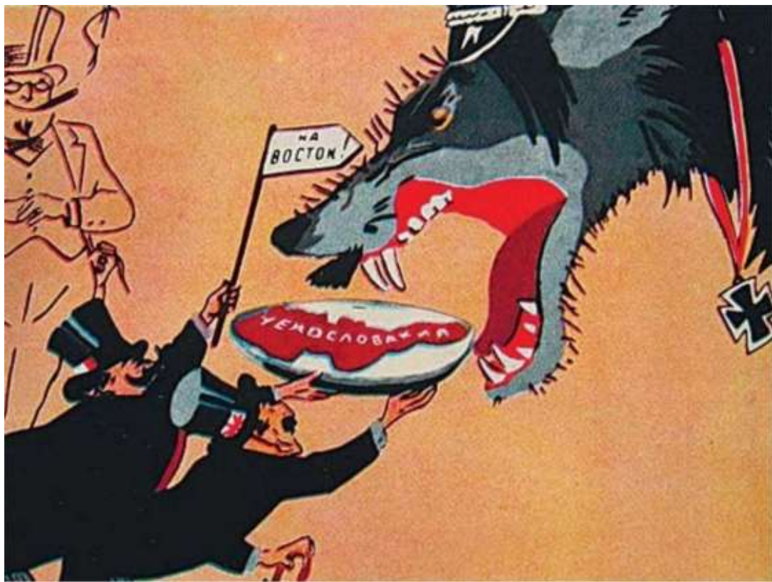
Мюнхенский сговор. Карикатура. Кукрыниксы, 1938 г.