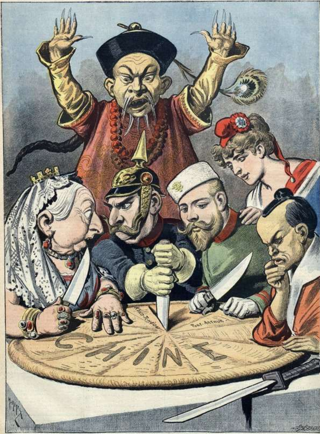
Раздел Китая иностранными державами. Карикатура А. Мейера 1890 г. Франция