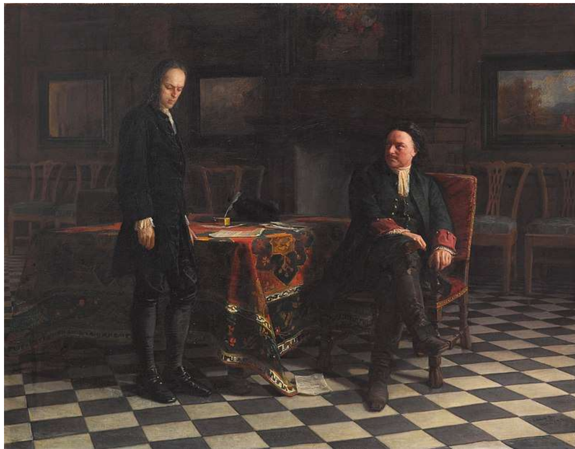
Петр 1 допрашивает царевича Алексея Петровича в Петергофе. Н. Ге, 1871 г.