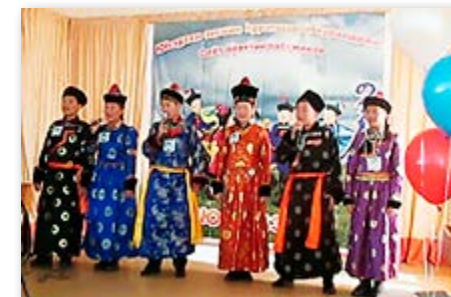
«Хэжэнгын мэргэшүүл» бүлгэм. 2017

Манай хургуули 2016 ондо түрэлхи хэлэнэйнгээ хүгжэлтын талаар Гүрэнэй программа бэслүүлжэ ябаһан Буряад Уласай үндэһэн соёлой хуралсалай эмхинүүдэй Эблэлэй бүридэлдэ ороһон байна.