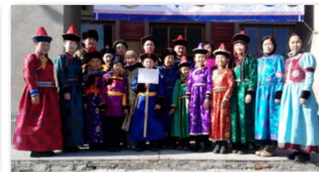
Захааминда III - дахи шангай хуурида гараабди