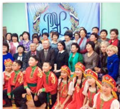
Ород Уласай хургуулида