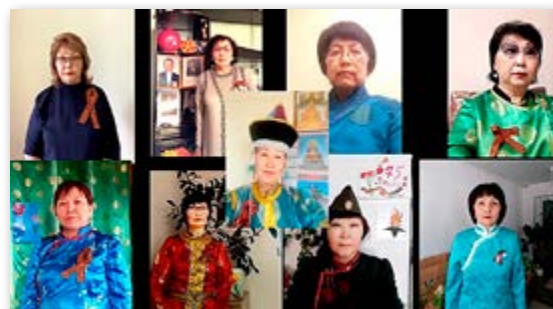
II - дохи шангай хуури Улаан-Үдэ хотын 60 – дахи хургуулийн эхин ангиин багшанар