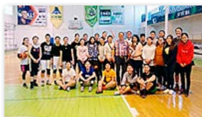
Суута «Этүгэнэй эрбэсүүд» гэхэн волейболой командалтай

гүүр, түргэн туһаламжын, бэсэ элүүржүүлгын, тамирай хүгжэлтын газарнуудаар, хамтын байраар профессортой экскурсида ябаабди. Хаа хаанагүй дэлгэрһэн түрэл хэлээрээ, зонингоо ажаһуудалаар, харилсаагаараа Монгол орон хурагшадта ехэ найшаагдажа, саашадаа аяншалгануудыг эмхидхэхэ, холбоогоо таһалхагүй тухай зүбшэн хэлсээбди.