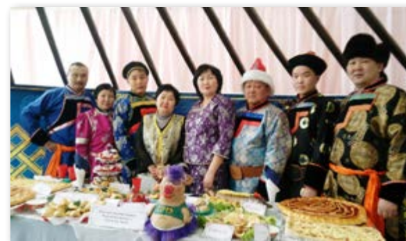
Сагаалган - 2019. Захааминай аймагай Сахирай интернат-хургуулиин хүтэлбэри

Энэ удаа Буряад ороной 13 хуралсалай эмхинүүд хоорондоо мурьсэхэн байна.