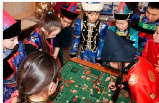
Сагаалган -2017. Цагаатайн хургуулида

Эмхидхэгшэд элдэб һонин урилдаануудыг соносоходог: заншалга Сагаа һарын амаршалга, хүндын шэрээдэ урилга, гар урлалай үзэмжэ дэлгээлгэ болон шагай наада, һээр шаалга, тэбэг сохилго, арадай дуунуудыг гүйсэдхэлгэ, арадай хүгжэмэй инструментүүд дээрэ наадалга, түрэлхи хэлэнэйнгээ хүгжэлтын түсэл зохёон хамгаалга, арадайнгаа ёһо заншалнуудыг хэргээлгэ г.м.