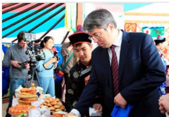
Буряад Уласай юрэнхылэгшэ А.С.Цыденов

Нютагаймнай захиргаан (Г.З.Лхасаранов) энэ харюусалгата хэрэг халуунаар дэмжэжэ, айлшадаа угтаха, байрлуулха, мурьсэхэ газарнуудаа бэлдэхэ асуудалнуудыг шийдхээ. Өөрын зүгһөө шангай мүнгэ һомолжо, Хэжэнгын аймагай