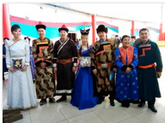
Сагаалган - 2018. Үндэһэтэнэй 1-дэхи лицей интернат хотын тамирай байшанда (ФСК) айлшадаа угтаа

Буряад уран зохёолой үндэһэ һуури табилсагша Х.Намсараевай расказуудай удахаар сценкэ зохёожо, «Одон» клубэй тайзан