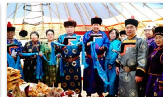
Сагаалган - 2020. Хэжэнгэ нютагташадаа