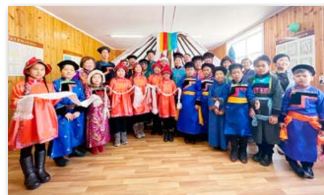
Сагаалган - 2021 түрэл хургуулидаа