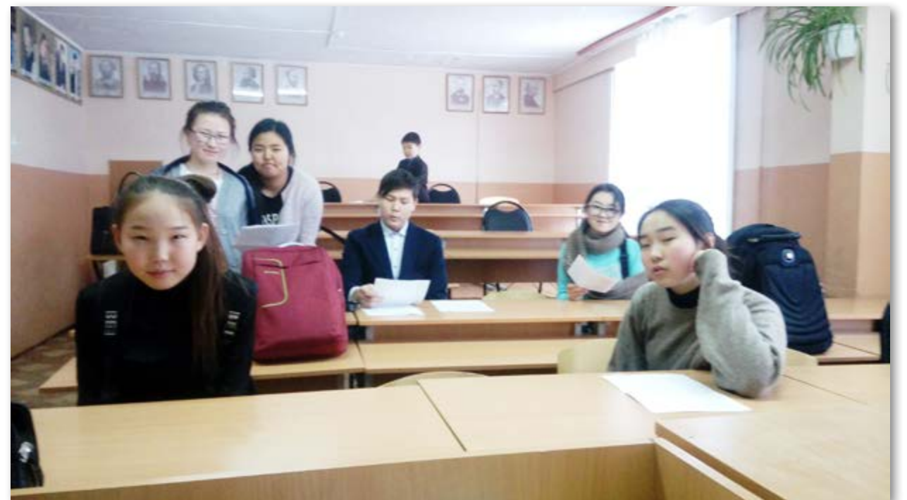
Текст бэлдэхэ ажалай үе