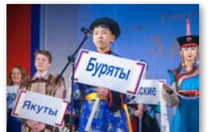
Манай хурагшад «Океан» түбтэ

«Танилсая!», «Ёһо заншалнууд», «Арадай нааданууд», «Үндэһэтэнэй хубсаһан», «Арадуудай урлал», «Үндэһэтэнэй эдсэ хоол», «Заншалта хайндэрнүүд» гэхэн урилдаануудта хабаадажа, түрэлхи арадайнгаа дүрэ шарай, бэлиг шадабари харуулан байна.