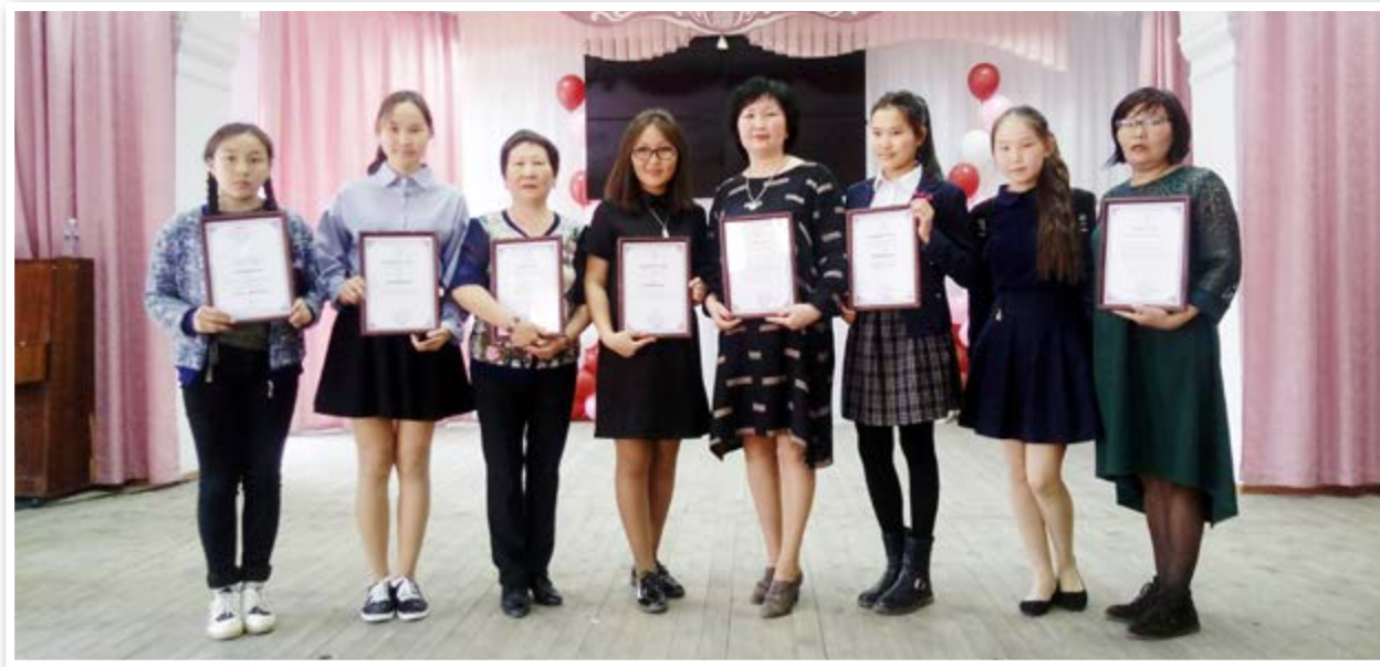
«Бэлигэй туяа» хуралдаанда эрхимлэгшэд

Нурагшадай эрдэм шэнжэлэлгын ажалда анхарал табигдадаг. Түрэл нютагайнгаа урдын ба мүнөө үсын түүхэ ба ёһо заншал, соёл тухай мэдэсээ үргэдхэхэ, һонирхон шэнжэлхэ, бодолоо элирүүлхэ, сэгнэлтэ үгэхэ хүсэлын аһи болохоор дэмжэгдэдэг.