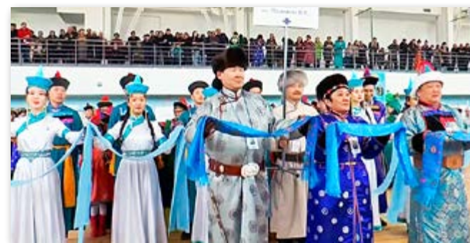
2020. хургуулимнай Сагаалганай найрта айлшадаа