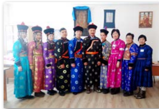
Хамбын наадамда хабаадагшад

хин «Бэлигэй толиин» туяа доро» гэгээн Хүүгэдэй наадам дасандаа үнгэргэдэг болоһон.