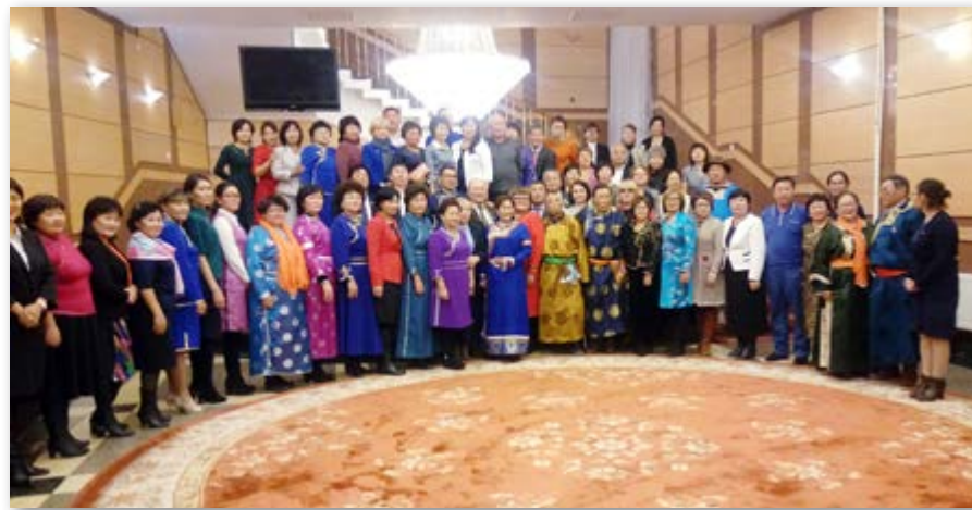
Уласхоорондын хуралдаанда хабаадагшад