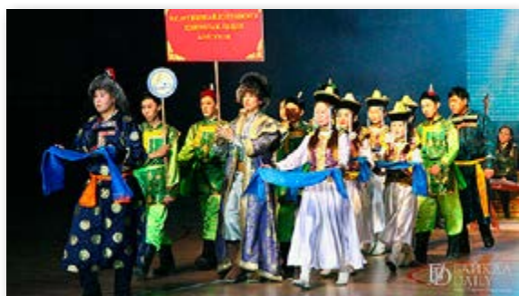
2016 оной Сагаалганай найр Эблэлэй бэридэлдэ угталга

2020 ондо В.С.Мункинай нэрэмжэтэ Хэжэнгын лицей ба Хэжэнгын дунда интернат-хургуули Эблэлэй Сагаа һарын найр наада нютаг дээрээ эмхидхэһэн байна.