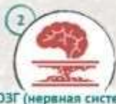
МОЗГ (нервная система)

? Никотин воздействует на нервную систему возбуждающе, ухудшается кровоснабжение мозга.