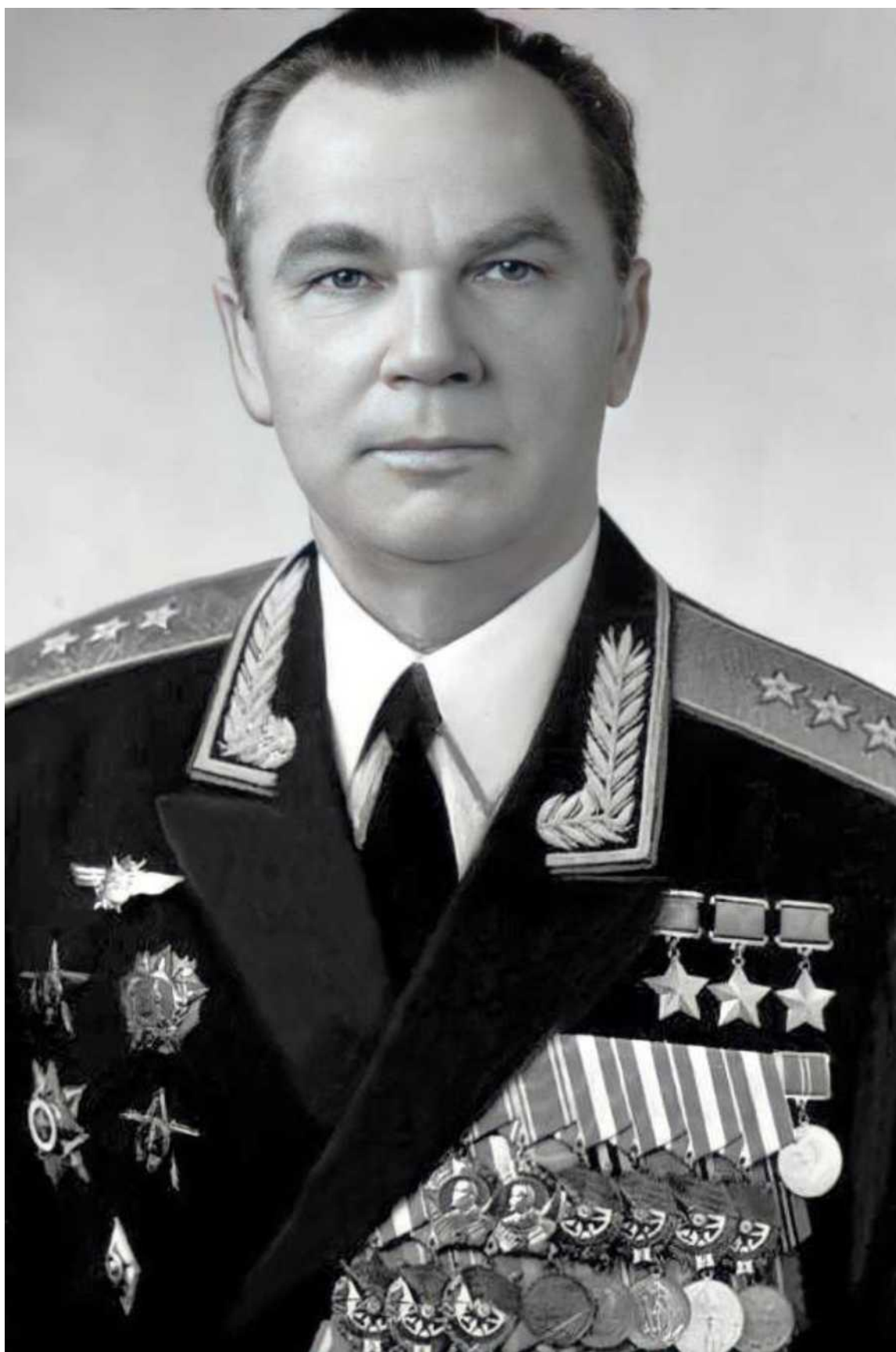
Иван Никитович Кожедуб

участник Великой Отечественной войны маршал авиации, легендарный летчик-ас, трижды Герой Советского Союза.