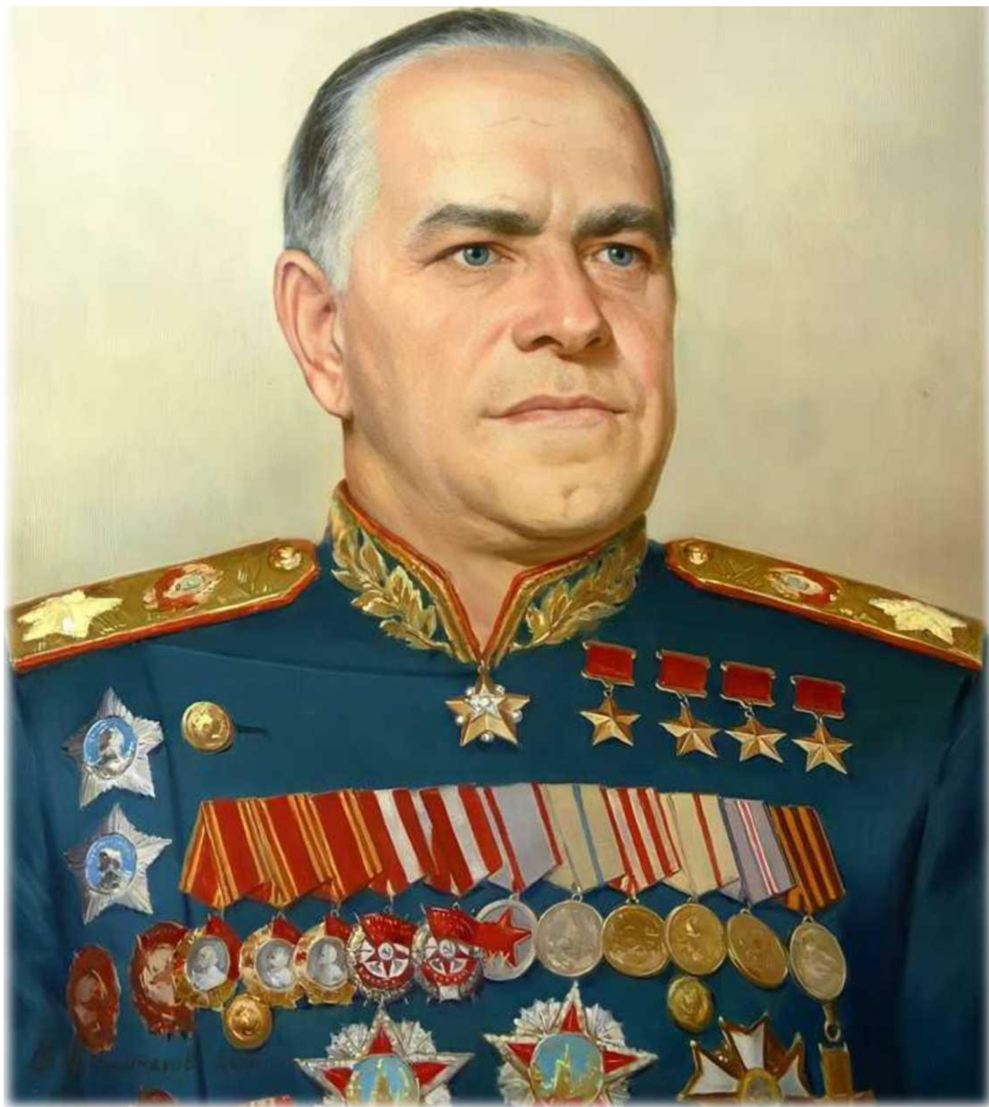
Георгий Константинович Жуков

Маршал Советского Союза, четырежды Герой Советского Союза