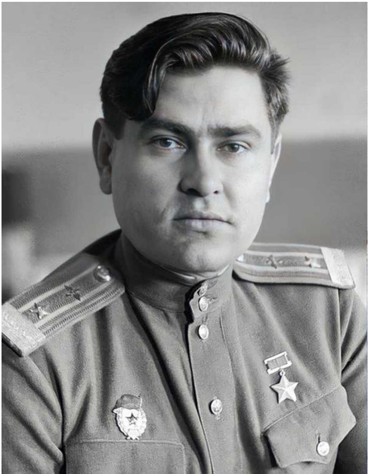
Алексей Петрович Маресьев участник Великой Отечественной войны летчик-истребитель, Герой Советского Союза.