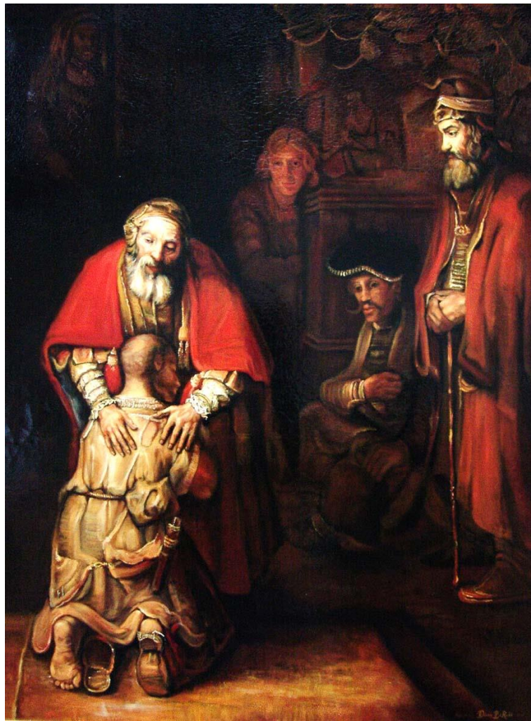
Рембрандт ван Рейн. Возвращение блудного сына. 1669 г.