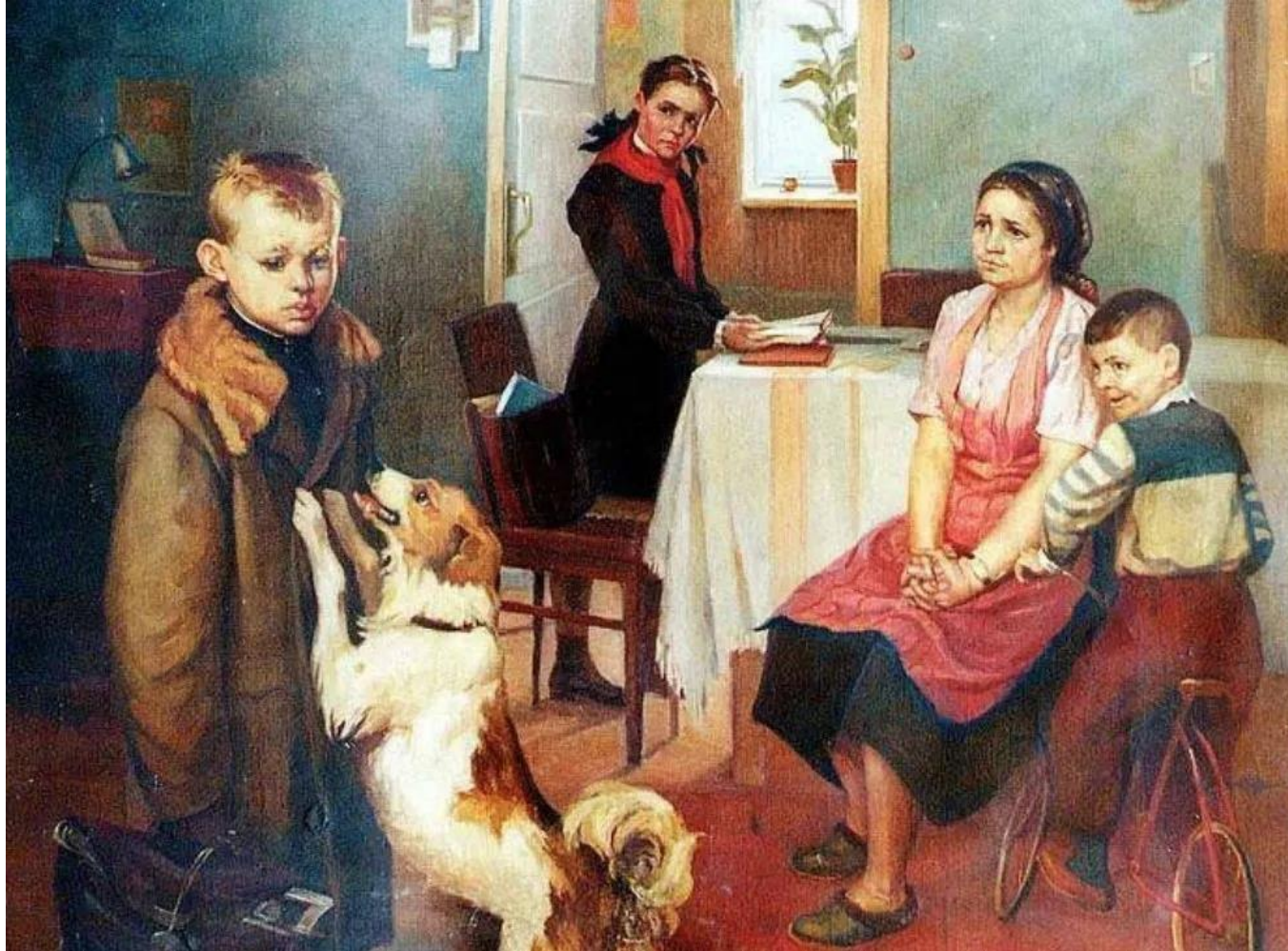
Федор Решетников. «Опять двойка». 1952 г.