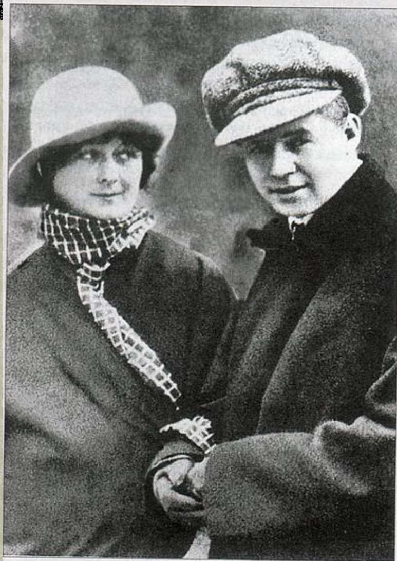
С. Есенин и А. Дункан