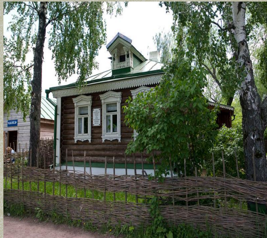
Дом Есенина в Константиново