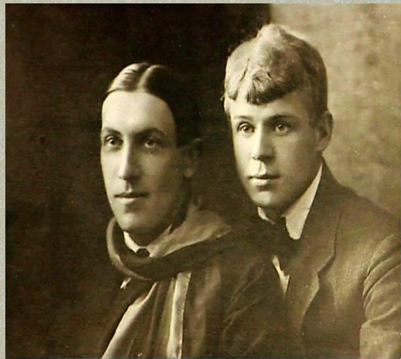
А. Мариенгоф и С. Есенин